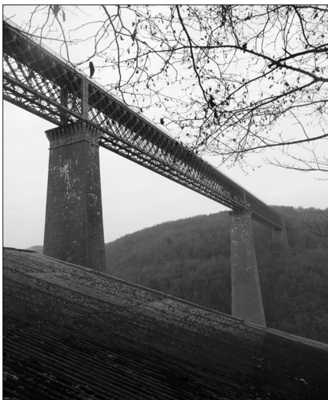
ILLUSTRATION 5 : Viaduc des Fades, Sioule et patrimoine.