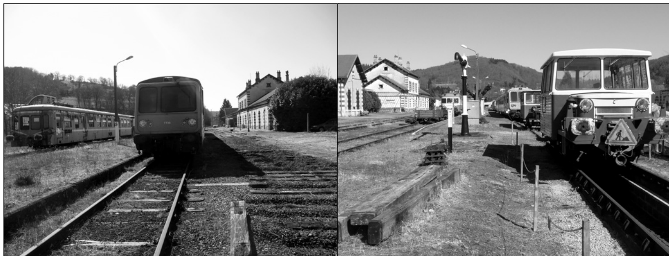
ILLUSTRATIONS 7 ET 8 : La gare de Bort-les-Orgues : un paysage entre friche et brocante.

du viaduc des Rochers noirs, a ainsi préféré interdire l'accès à l'ouvrage d'art. Il est désormais seulement possible de le contempler depuis les belvédères aménagés de part et d'autre de la vallée de la Luzège. Les associations sont désormais de plus en plus dépendantes de la décision des autorités pour mener à bien un projet de valorisation touristique.