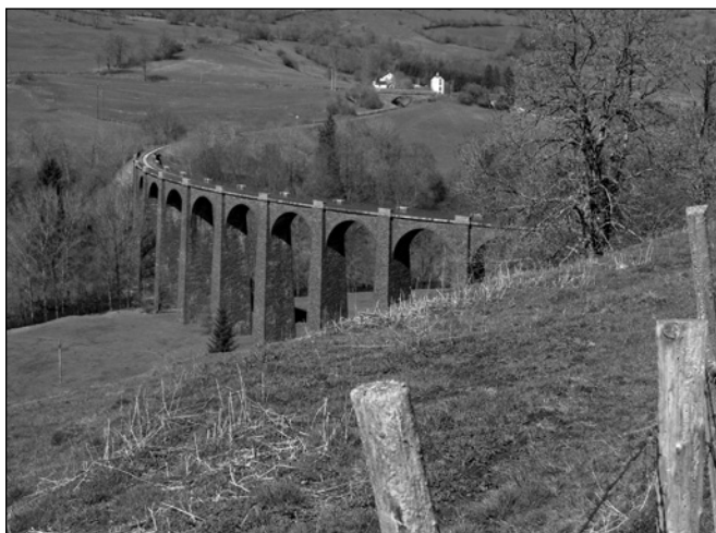
ILLUSTRATION 3 : Viaduc de Saint-Saturnin.