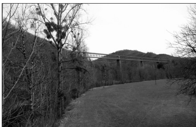
ILLUSTRATION 6 : Viaduc de la Sumène, Vendes Viaduc Village.

sur les derniers coûts d'entretien et de mise en valeur de l'édifice sont très évocateurs des enjeux. La remise en état conduite en 1994 a coûté 13 millions de francs (soit environ 2 millions d'euros), auxquels il faut rajouter une opération de remise en peinture (dans sa livrée historique d'origine dite « rouge Gauguin ») entre décembre 2001 à juin 2003, pour un