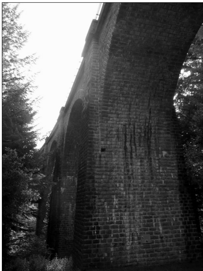
ILLUSTRATION 4 : Viaduc des Farges, Vienne Vézère Vapeur.