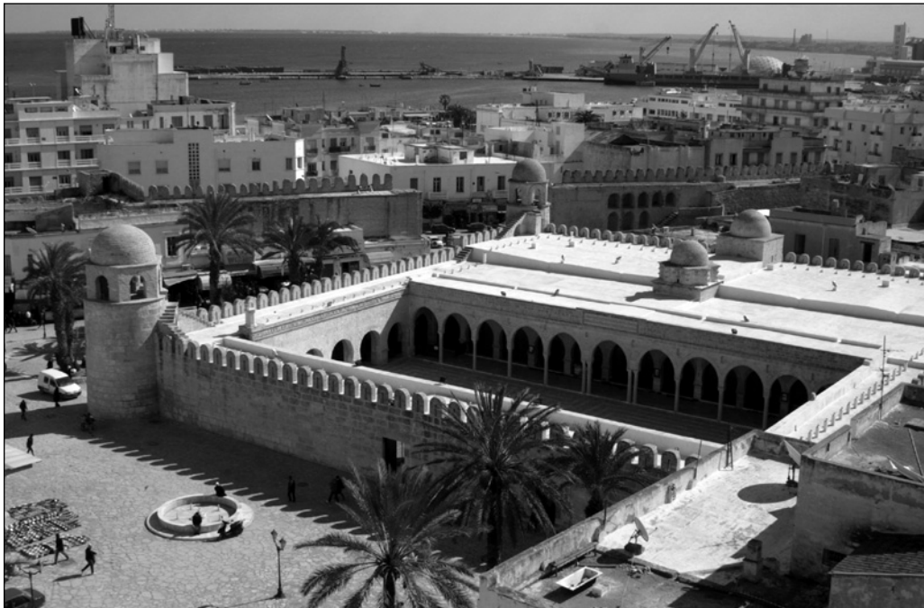
ILLUSTRATION 1 : Une vue de la Grande Mosquée depuis la tour du Ribat (photo : MONTADA).