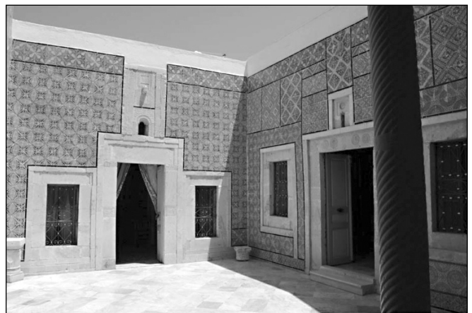
ILLUSTRATION 3 : Dar Essid, le patio d'une maison traditionnelle transformée en musée privé.

le million de visiteurs en 2009, 75 271 ont visité la médina, soit près de 7 % du total de la ville de Sousse (ONTT, 2009). Il est important de souligner qu'il s'agit, pour la quasi-totalité, de visites incluses dans le séjour par les voyageurs et, pour une infime partie, de prestations proposées par les agences de voyage locales à travers les hôteliers.