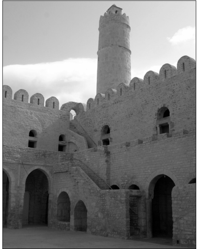
ILLUSTRATION 2 : Une vue intérieure de la cour du Ribat.

Les statistiques de l'AMVPPC (nombre d'entrées aux monuments avec entrée payante : Grande Mosquée, Ribat, Musée archéologique) permettent d'évaluer la demande touristique de la médina. On considère après enquête que tout visiteur ayant visité le Ribat a visité en conséquence une partie au moins de la médina. Ainsi, pour Sousse, le nombre total des visiteurs des trois sites inscrits pour la Grande Mosquée, Ribat et la médina (le Musée est fermé pour rénovation depuis 2008) est en régression, tandis que les chiffres pour la ville de Sousse en tant que destination sont stabilisés autour du million de touristes sur les quatre dernières années (voir tableau 1). Sur