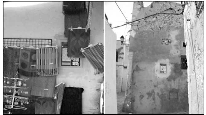
ILLUSTRATION 4 : Une signalétique non adaptée (photo : MONTADA).

L'importance des parties prenantes dans le tourisme en général et dans la gouvernance des actifs culturels est soulignée par de nombreux travaux (Flagestad et Hope, 2001 ; Yilmaz et Gunel, 2009 ; ou Carrière, 2009). Freeman (1984) aborde la gouvernance des parties prenantes en distinguant trois niveaux : 1) le niveau rationnel qui consiste à repérer les parties prenantes et leurs intérêts respectifs ; 2) le niveau inhérent aux processus permettant de prendre en compte les intérêts des parties prenantes dans les programmes d'élaboration, d'application et de contrôle de la stratégie mise en œuvre ; et 3) le niveau