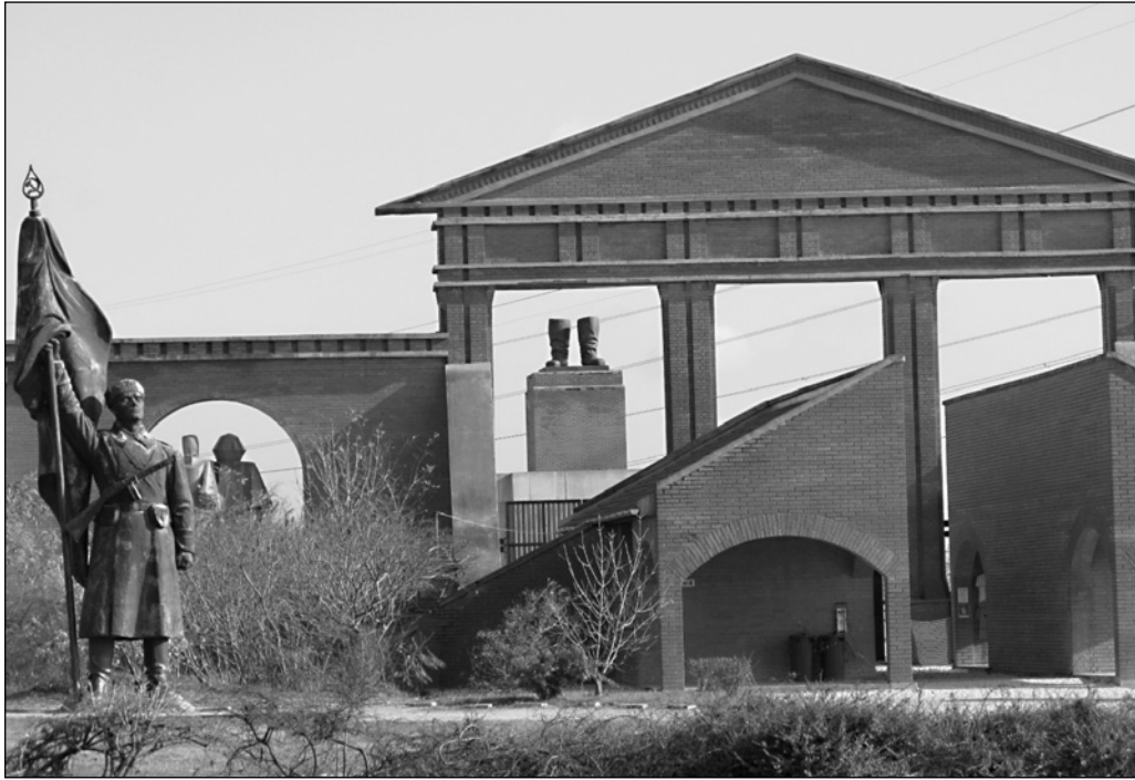
ILLUSTRATION 6 : Le Memento Park.

Le tourisme peut également jouer un rôle dans la mise en valeur d'un autre type de patrimoine, le patrimoine hérité de la période soviétique. Ce dernier ne se trouve pas au cœur de la ville, contrairement aux sites UNESCO ou au quartier juif, mais à sa périphérie. Toutes les traces du passé soviétique de Budapest ont en effet été regroupées sur un vaste terrain, donnant naissance à un nouveau lieu à la fois touristique et patrimonial : le Memento Park, appelé aussi le parc des statues (voir illustration 6). Sa localisation périphérique signifie qu'il s'agit de ne pas oublier le passé soviétique sans toutefois l'exposer au centre de la ville. Au cœur de Budapest, seule la Maison de la Terreur (musée installé dans les locaux de l'ancienne police secrète AVH), située sur l'avenue Andrassy, rappelle cette période.