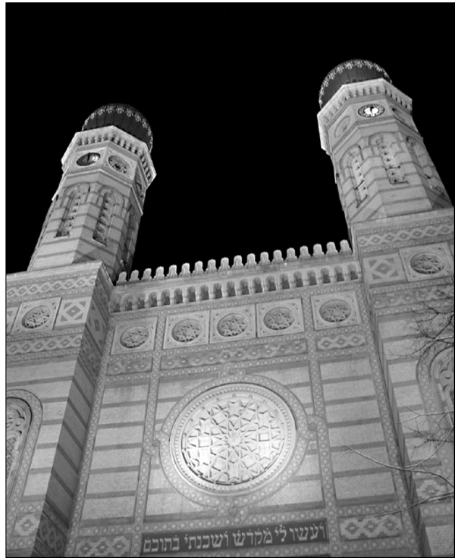
ILLUSTRATION 5 : La Grande Synagogue, monument central du quartier juif.

dans tout cela ? En réaction aux scandales et aux menaces de destruction, de nombreux livres et guides sur ce quartier ont été publiés et de nombreux restaurants juifs ont ouvert. Des touristes visitent aujourd'hui ce quartier particulier, pour des raisons variées : religieuses (avec le rôle très important de la Grande Synagogue, la plus grande du monde après celle de New York, voir illustration 5), gastronomiques, historiques ou encore culturelles. Un tourisme de mémoire se développe également avec le mémorial de l'Holocauste et la mise en valeur du mur du ghetto.