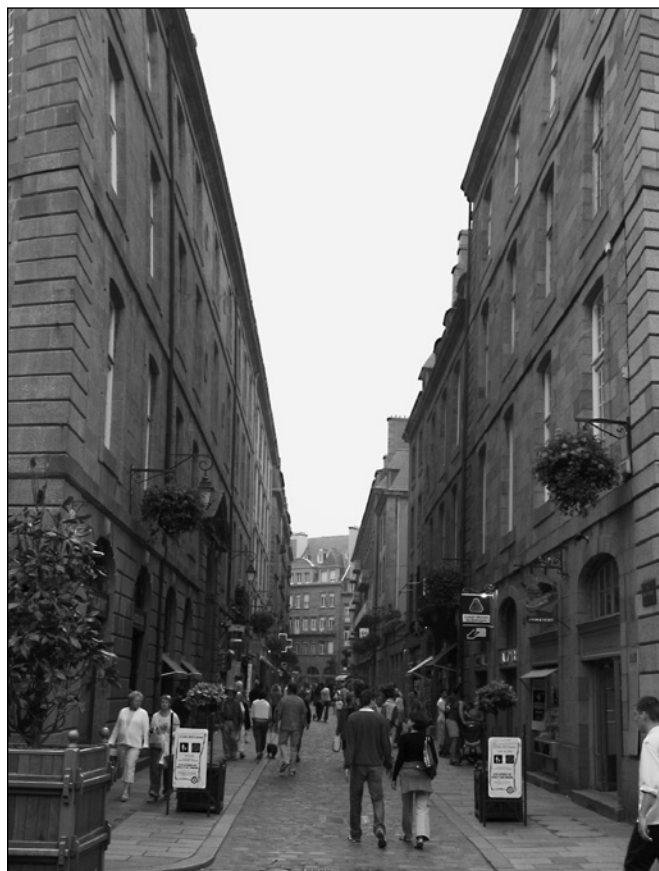
ILLUSTRATION 2 : Rue commerçante de Saint-Malo.

architecture, un paysage, un jardin) qui figent dans un énoncé, au moins de façon provisoire, une représentation qui devient dès lors communicable. Vincent Coëffé a appelé « marqueurs spatiaux » les formes matérielles qui suscitent et incarnent des intentions, et qui rendent visibles les représentations que se font les acteurs de l'espace et du temps (Coëffé, dans Rieucou et Lageiste, 2006 : 177). Par exemple, la cité intra-muros de Saint-Malo, avec ses remparts assurant une promenade circulaire dominant la plage et la mer, correspond à un lieu de contemplation privilégié par les touristes. Mais, par son cœur commercial composé de divers commerces et services, la cité intra-muros de Saint-Malo s'apparenterait plutôt à un centre urbain « traditionnel » pour la population locale. Cependant, la présence récurrente de « géosymboles » (Bonnemaison, 1999) de la Bretagne, tels que les drapeaux ornés d'hermines, les biscuits et cidres ou encore la faïencerie et autres produits dérivés de la marque « Bretagne », correspondent aux attentes de la région pour les visiteurs (voir illustration 2).