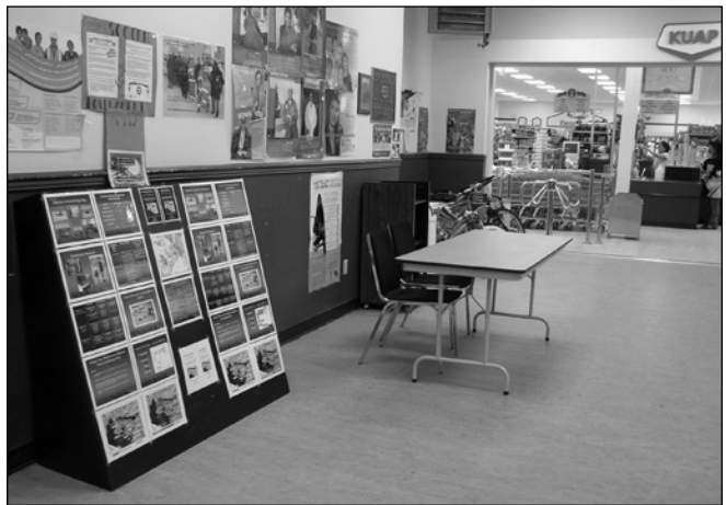
ILLUSTRATION 3 : Affichage à Cambridge Bay.