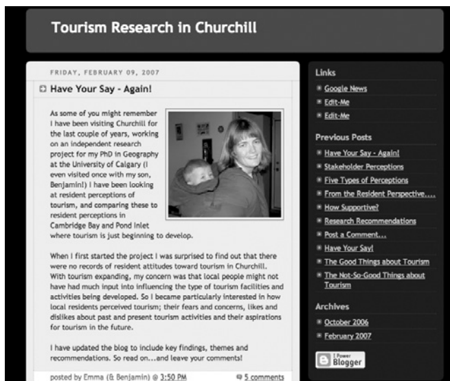
ILLUSTRATION 4 : Blogue sur les travaux de recherche créé pour Churchill (source : http://tourism-in-churchill.blogspot.com/ ).

affiches ont été laissées aux communautés concernées, dans les écoles ou les bibliothèques, pour qu'elles les réutilisent à leur gré.