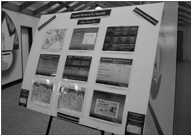
ILLUSTRATION 2 : Affichage à Churchill.