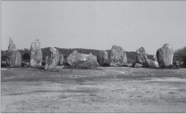
ILLUSTRATION 2 : Vue sur le site de Kermario en 1988.

de haut, érigées au néolithique (il y a environ 5 000 ans) (Bailloud et al. , 1995). Ces files de pierres se répartissent sur trois grands ensembles, séparés par des vides archéologiques qui s'étalent sur une longueur totale de près de quatre kilomètres sur une largeur d'une centaine de mètres, longés et traversés par diverses routes.