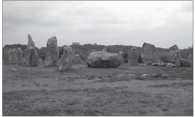
ILLUSTRATION 3 : Vue sur le site de Kermario en 2010.

Face à cette situation, à la fin des années 1980, le ministère français de la Culture a pris la décision de mettre le site en défens (fermeture effective entre 1991 et 1993) afin de permettre la restauration (par recolonisation naturelle) d'un couvert végétal garantissant la préservation des sols archéologiques. La fermeture est réalisée par des grillages métalliques verts dont la hauteur actuelle est d'environ un mètre (initialement plus haut, ils ont été réduits) qui divisent le site en différents