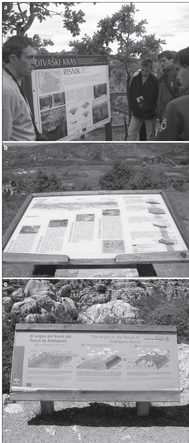
ILLUSTRATION 2 : a) Sentier géotouristique autour de la doline d'effondrement de Divača, Slovénie ; b) panneau d'interprétation au niveau des gorges du Chassezac, bas Vivarais, France ; c) sentier géotouristique dans le site karstique del Torcal de Antequera, Espagne.

visant à satisfaire les différentes attentes du public touristique (Biot, 2006). Le géodiscours, en se combinant à d'autres types d'expériences touristiques, engendre des objets hybrides où le géotourisme est associé à d'autres dimensions.