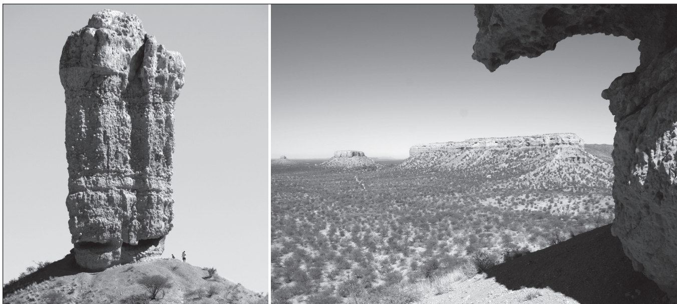
ILLUSTRATION 1 : Site monolithique de Vingerklip, Namibie.

non?) de la médiation scientifique n'est pas remplie. Nombre de sites aux caractéristiques géologiques ou géomorphologiques impressionnantes se visitent sans qu'il y ait pour autant la moindre information concernant les sciences de la Terre. Cela est vrai tant pour des géosites des pays du Nord (nombreux sites volcaniques isolés du massif central en France) que des pays du Sud. Ainsi, l'exemple du site de Vingerklip, Namibie (voir illustration 1) : pour un droit d'accès symbolique (1 €), on est autorisé à traverser une propriété privée et à garer sa voiture au pied de ces formations surprenantes. Le seul aménagement consiste en un chemin mal entretenu qui permet d'accéder à un point de vue. Aucune forme de médiation scientifique n'est proposée. Le touriste n'a absolument aucune clef de lecture pour comprendre les paysages qu'il observe.