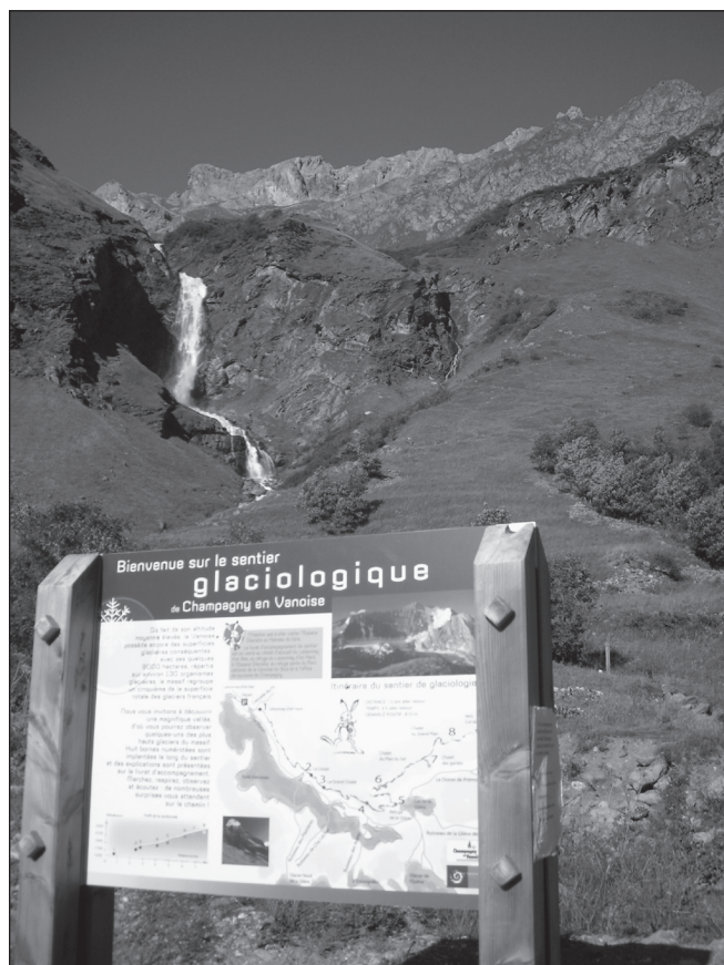
ILLUSTRATION 3 : Le sentier glaciologique de Champagny-en-Vanoise, France. Mis en place en 2007, celui-ci s'inscrit dans une volonté de développer le tourisme estival dans un espace marqué par les pratiques hivernales autour du ski alpin.

L'éruption actuelle du Vésuve met en mouvement la plupart des étrangers ici et il faut se faire violence pour ne pas se laisser entraîner. Ce phénomène naturel a réellement quelque chose du serpent à sonnettes, il attire les hommes avec une force irrésistible. Pour l'instant il