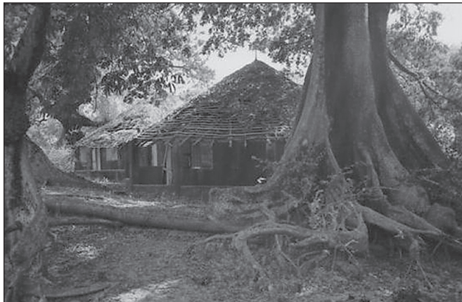
ILLUSTRATION 5 : Le village de Diembéring, cases abandonnées du campement d'Eten-Elou.

coté de la création des infrastructures de base à l'édification d'un véritable plan de développement du tourisme mettant l'accent sur le développement local dans les zones rurales à « vocation » touristique. Cependant on peut s'interroger sur la priorité donnée à la pérennisation de cette expérience à la lecture du Projet d'urgence d'appui à la reconstruction de la Casamance (PARC) et à celle du Programme de relance des activités économiques et sociales en Casamance (PRAESC). Ces documents officiels des services compétents sénégalais sont peu bavards sur la relance du tourisme en Basse-Casamance. Il est fait mention d'« appui aux initiatives à vocation économique », de « priorité aux infrastructures et équipements communautaires ».