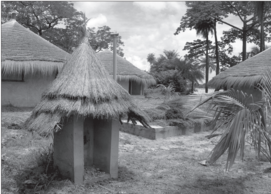
ILLUSTRATION 3 : Le village de Coubalan, vue sur la partie centrale du campement avec les nouvelles cases et en arrière-plan le fleuve Sénégal.

exemple est le produit « Rando et Kayak en pays Diola », d'une durée de neuf jours, extrait de la brochure Nomade Aventure qui privilégie les nuits en campement dans les cases à impluvium (Enampore, M'lomp).