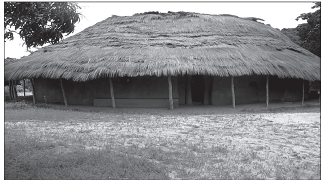
ILLUSTRATION 2 : Le village d'Enampore, aperçu de l'immense bâtiment rond à double toit de la case à impluvium.

Au début des années 1990, le « tourisme rural intégré » est brutalement compromis alors que les exactions se multiplient (400 morts en 1992-1993). En 1995, plusieurs touristes français sont portés disparus, on ne retrouvera jamais leurs corps. Cet événement sera dramatique, la clientèle européenne constituant 95 % des arrivées dans les campements de la région de Ziguinchor selon les statistiques du ministère du Tourisme et des Transports aériens de cette période. Au plus fort de la saison touristique, en janvier 2001, le campement d'Enampore n'enregistre que 21 nuitées, pourtant l'armée surveille de près l'ensemble des zones touristiques de la Casamance et investit les campements pour protéger les Occidentaux (Mané, 2001 : 57).