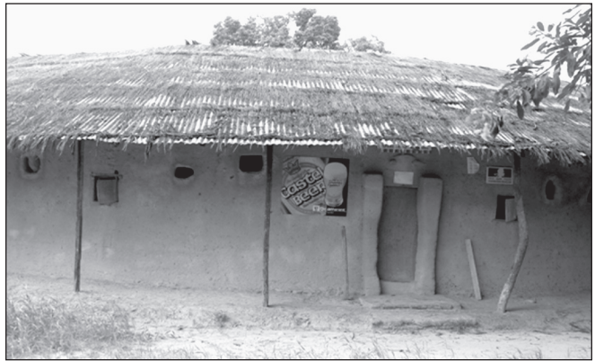
ILLUSTRATION 6 : Le village d'Affiniam, la principale case à impluvium du campement réhabilitée par la coopération française (photo : Jean-Philippe Principaud).

Des acteurs privés sénégalais ou étrangers investissent dans la construction ou la reconstruction de campements privés majoritairement sur ou à proximité du littoral, avec l'implication des populations locales plus au moins affirmée. Deux exemples peuvent-être soulignés. D'une part, le campement privé de Diembéring à 10 km au nord du