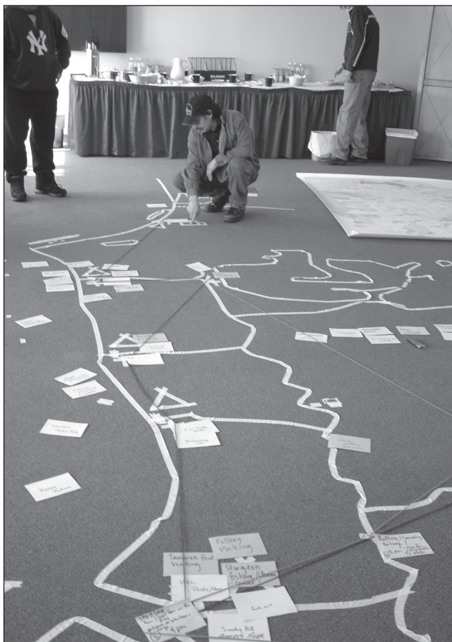
ILLUSTRATION 5 : La carte au sol du territoire de Eeyou Istchee dans les ateliers participatifs.