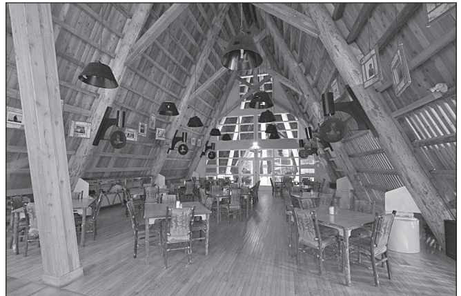
ILLUSTRATION 2 : Le Cree Village Écologie dans l'île de Moose Factory.

La relance du projet de loge de Washow sert de prétexte pour solliciter les chercheurs. Il leur est demandé de jouer le rôle de facilitateurs et d'accompagner les différents acteurs du tourisme dans une réflexion sur le devenir de la destination de Moose Factory. Quatre missions se succèdent, en juillet et novembre 2007, en mars 2008 et puis de nouveau en juin 2009. À chaque visite, toutes les opportunités sont saisies pour imaginer comment les deux communautés pourraient travailler de concert autour d'une vision et d'une stratégie de tourisme cri. Les visites des chercheurs sont organisées autour d'ateliers de travail de 4 à 5 heures d'affilée et rassemblent des petits groupes d'acteurs et des publics très variés : guides, trappeurs, gestionnaires de loges, artisans d'art. Les chercheurs s'appuient sur les chargés de mission en développement économique, en tourisme, en culture, en commerce, et préparent avec soin la conception des ateliers avec leur complicité. L'objectif est dans un premier temps de traiter chaque groupe d'acteurs et leurs