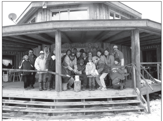
ILLUSTRATION 3 : La Washow Lodge situé à Hannah Bay, à 75 km de Moose Factory.

projets individuellement (le centre culturel cri, l'association d'artisanat, la loge). Le but ultime est de préparer et d'organiser au final un regroupement de l'ensemble des acteurs dans un atelier communautaire sur le mode des Big Gathering (grand rassemblement annuel ou festival ou pow-wow qui rassemble toute la communauté autour de chants et de danses traditionnels) permettant de définir une vision commune et fédératrice autour de Moose Factory comme destination de tourisme cri dans l'Ontario.