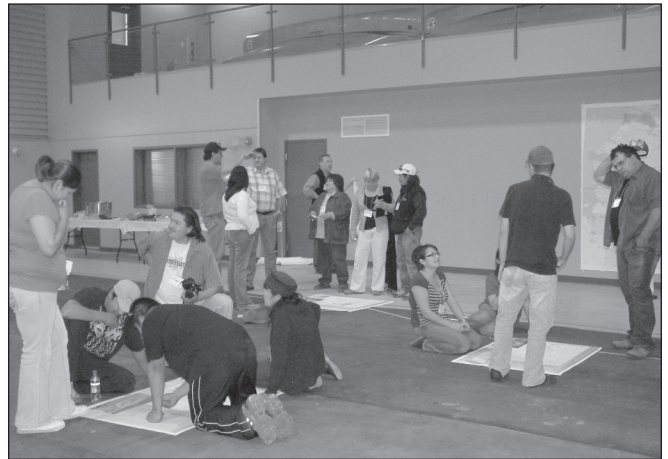
ILLUSTRATION 4 : Conception des routes à thème sur la carte au sol du gymnase lors de l'atelier participatif d'août 2008 à Nemaska, réunissant 40 personnes.

Les ateliers de recherche participative sont intégrés dans le projet FootSteps and Paddle Strokes lui-même comme des étapes indispensables à sa progression et financés comme partie intégrante du projet. Les trois ateliers participatifs de trois jours chacun accompagnent le projet FootSteps et Paddle Strokes sur une durée d'un an : un atelier de démarrage du projet en mars 2008, un atelier de conception d'ateliers communautaires pour les diagnostics de terrain, de formation des animateurs touristiques en juin 2008, et un atelier de validation