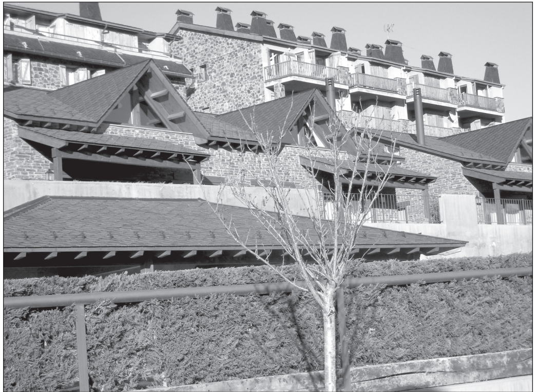
ILLUSTRATION 3 : La résidentialité barcelonaise « identitaire » et la reconfiguration du paysage montagnard (Cerdagne).

L'impact territorial et paysager va dépendre de l'importance de l'investissement, de son positionnement par rapport à d'autres modalités touristiques. Ainsi y a-t-il peu de rapports entre un village d'une campagne banale où la seule résidentialité secondaire est celle de descendants lointains qui viennent de loin en loin et le retour dans une station touristique de familles émigrées.