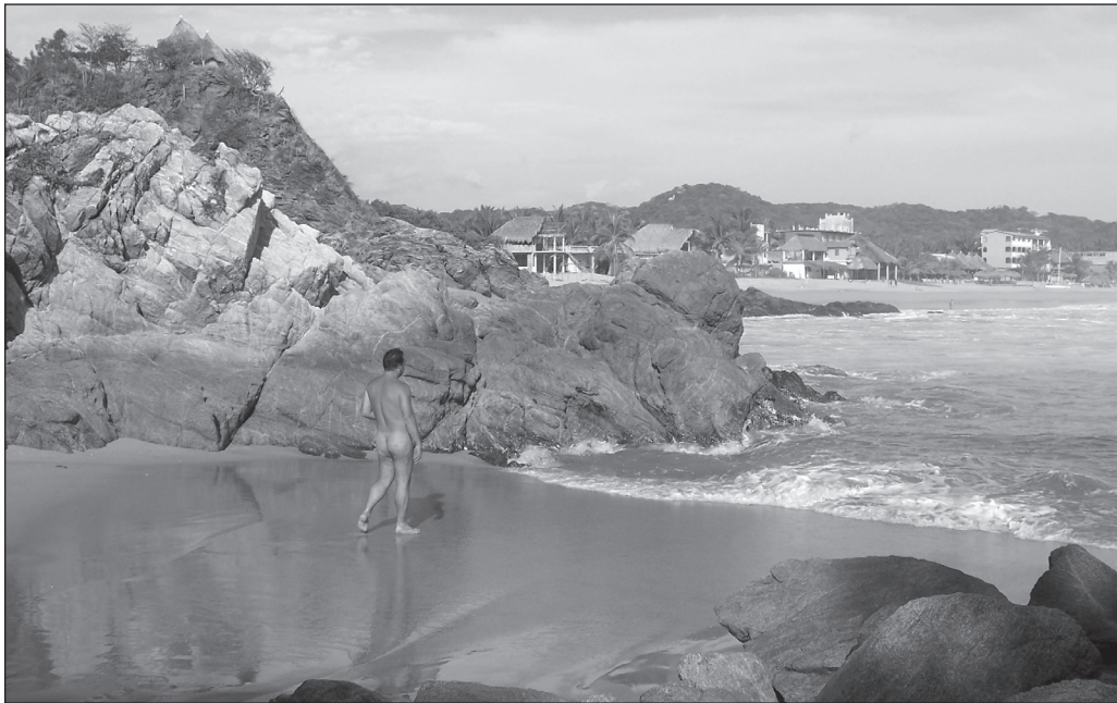
ILLUSTRATION 3 : Nudiste sur la plage de Zipolite.