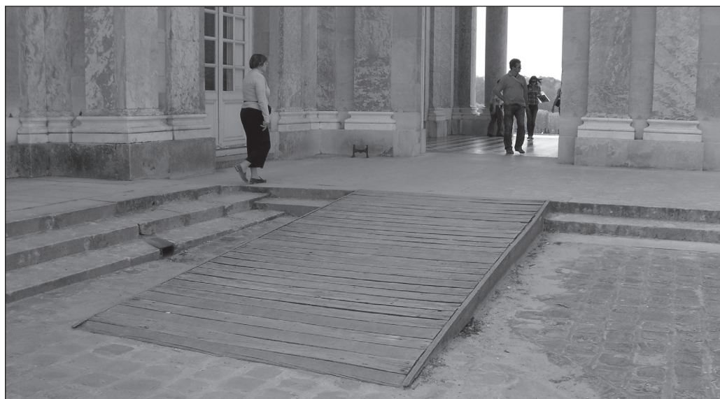
ILLUSTRATION 3 : Rampe d'accès au Château de Versailles.

touristiques et les loisirs accessibles à tous », la région Nord-Pas-de-Calais a lancé une opération de labellisation, sous l'égide de la délégation régionale de l'APF, du Conseil général et régional du Nord. Ce label intitulé « Le tourisme, c'est pour tous », aisément identifiable par un logo, est attribué aux structures touristiques accessibles. En 1997, 120 labels de ce type ont été attribués, près de 300 en 1998 et plus de 330 en 1999. Un autre système de pictogrammes utilisé par Village Vacances Familles (VVF) avec le partenariat de l'APF, consiste en l'application et la diffusion de sigles définissant des catégories de séjours selon leur accessibilité. D'autres labels, soutenus par des fédérations sportives, tels que le label