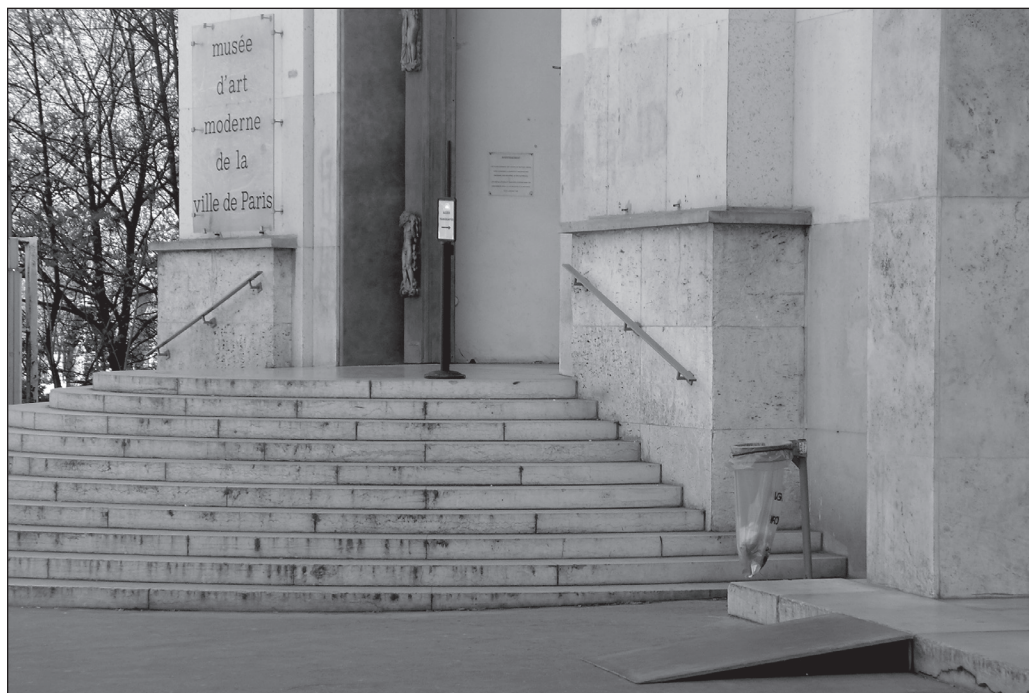
ILLUSTRATION 4 : À côté de l'escalier d'entrée, l'accès adapté du Musée d'art moderne de la ville de Paris.