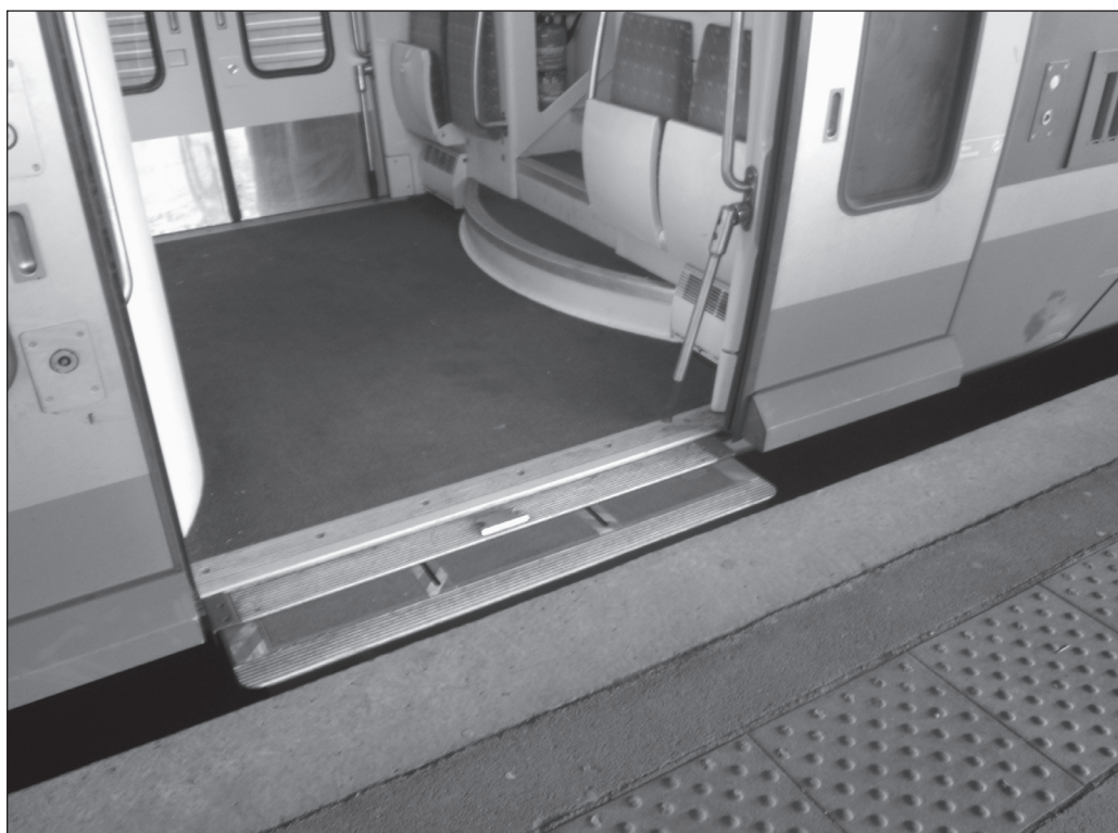
ILLUSTRATION 2 : Passerelle pour l'embarquement des personnes en fauteuil roulant dans un train à quai (photo : Frédéric Reichhart).