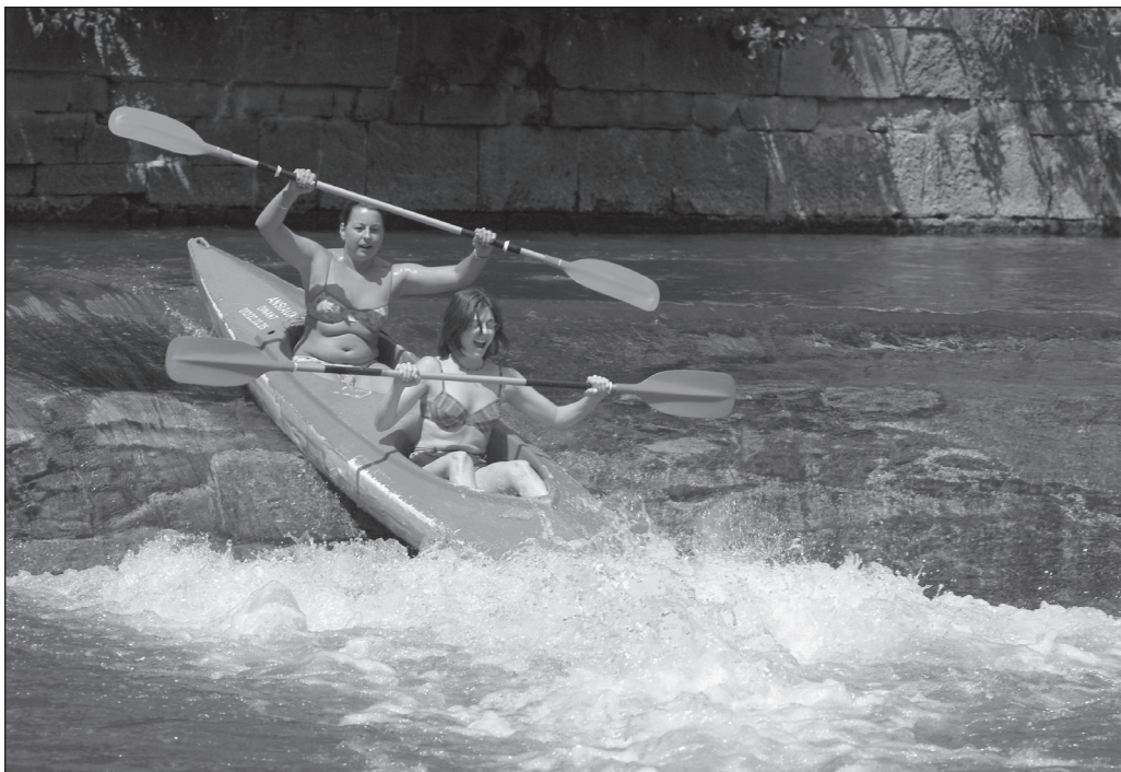
ILLUSTRATION 1 : La descente de la Lesse en kayak est une activité récréative et peu technique.

À l'instar d'autres destinations touristiques européennes, on observe en Wallonie, ces dernières années, une diminution du nombre de nuitées parallèlement à une augmentation du nombre d'arrivées, entraînant ainsi une chute de la durée moyenne de séjour. En 2006, les attractions touristiques wallonnes ont attiré, quant à elles, environ 8,25 millions de touristes