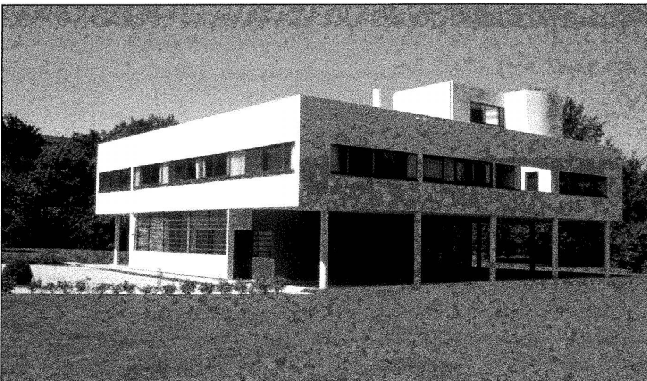
Villa Savoye. Vue d'ensemble.

l'espace découvert, contrastant avec l'herbe verte, la « Villa aux heures claires 12 » stupéfait le spectateur qui préfère d'abord l'appivoiser à distance. Ce n'est qu'une fois à l'intérieur qu'il se rassure. Un petit accueil, aménagé sur le comptoir intégré de l'entrée, se révèle discrètement. Quelques ouvrages ornent la table du guichet d'entrée. Le droit d'entrée payé, la maison est livrée au visiteur. La première pièce visitée propose quelques sobres panneaux à la lectu-