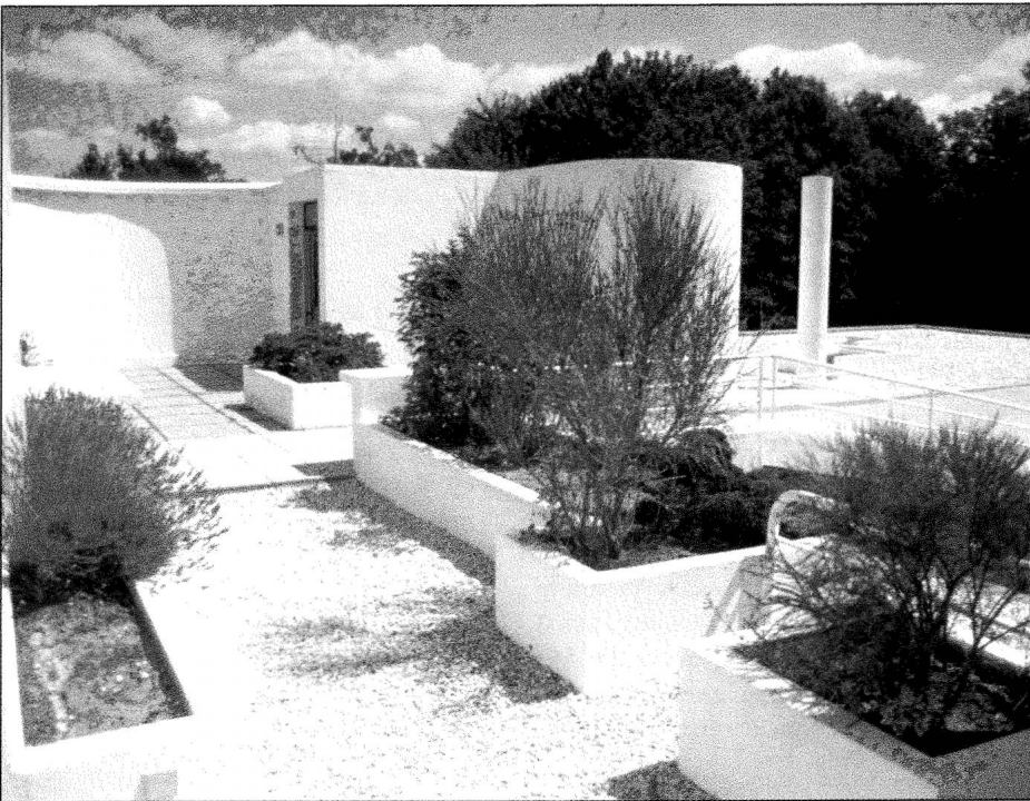
Villa Savoye. La terrasse sur le toit.

clichés ; le champ est libre, les appartements vastes respirent avec les fenêtres en bandeau qui accueillent les jeux d'ombre et de lumière. Mais c'est le mouvement qui est aussi recherché, celui de l'homme qui s'empare des lieux. Bon an mal an, c'est 20 000 visiteurs qui foulent le seuil de l'entrée vitrée. Certains s'émerveillent, d'autres se cambrent, mais assurément, bien peu peuvent rester indifférents. C'est toute l'attitude de Le Corbusier qui se reflète dans cet édifice. Ponctuée par quelques meubles inimitables et une petite maquette isolée sur la table de verre du séjour, le parcours n'a rien d'une promenade ludique. Le Corbusier disait d'ailleurs que « l'art est une chose austère qui a ses heures sacrées » (Le Corbusier, 1923 : 78) et la mise en valeur du monument tend à lui donner raison.