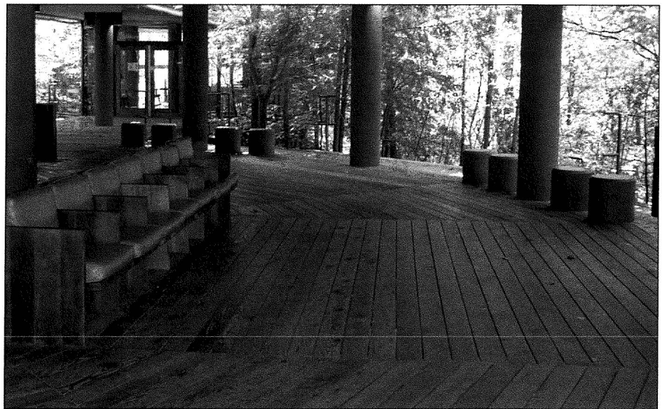
Fallingwater. Le pavillon d'accueil.