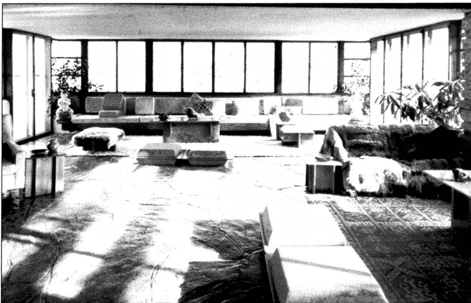
Fallingwater. Le salon.

Intellectuel, artiste aux talents multiples, Le Corbusier est très tôt inspiré par les progrès techniques de son époque ; sa conception incarne avec brio les principes et procédés les plus novateurs. Polémiste, il prône l'utilisation de matériaux nouveaux et rejette les styles historiques, référents omniprésents chez ses prédécesseurs et contemporains. Préconisant la standardisation des méthodes de production dans l'habitat moderne, il utilise une rhétorique rationnelle pour enflammer son auditoire. C'est ainsi qu'il