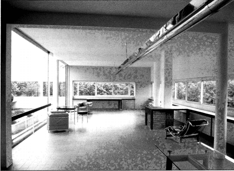
Villa Savoye. Le grand salon qui s'ouvre sur la terrasse à l'étage.

La Villa aux heures claires réjouit le photographe qui peut s'adonner à une séance de