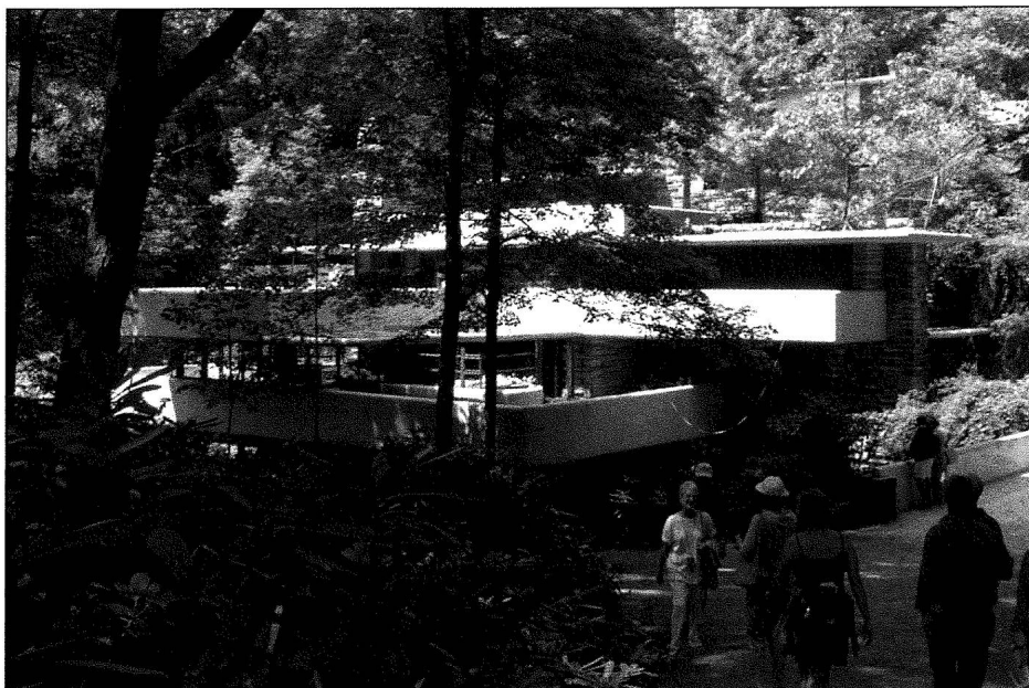
Fallingwater. Vue d'ensemble.

veille tout en découvrant les détails de l'histoire du lieu et qui découvre, une fois à l'intérieur, une ambiance tantôt caverneuse dans les corridors, puis chaleureuse dans les appartements généralement exigus. La maison est meublée et toutes ses pièces sont parées des œuvres et des accessoires dont les Kaufmann se servaient.