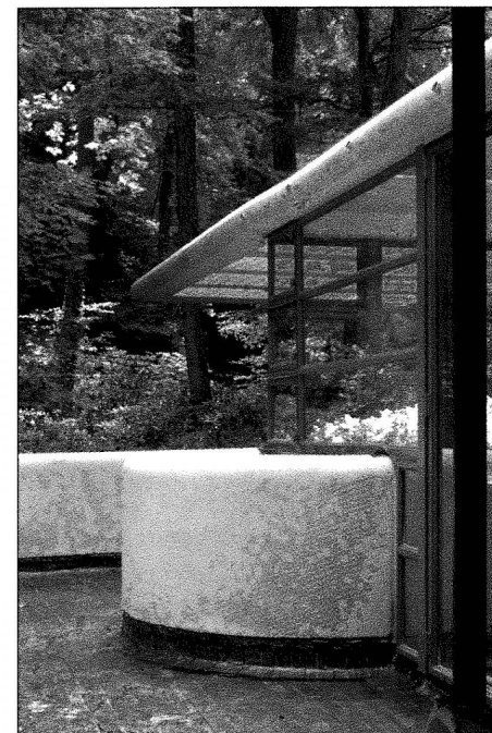
Fallingwater. La terrasse et les parois.