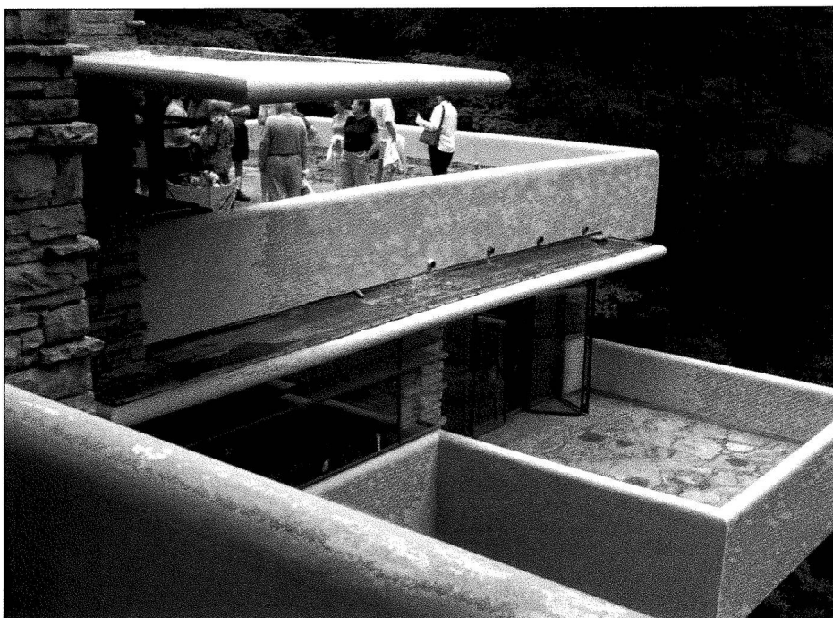
Fallingwater. Les terrasses. Photo : Hassoun Karam.

succèdent. Rien de surprenant quand on sait que 145 000 visiteurs accèdent chaque année à la maison. De ce nombre, à peine 20 % sont étrangers. Grâce aux audio-guides et aux documents adaptés, même ceux qui connaissent peu l'anglais y trouvent leur compte. Le parcours se termine à la maison des invités qui jouxte le bâtiment principal. La visite prend fin dans une salle de projection où la WPC procède à une séance destinée à recruter des membres supporters. Ce qui étonne le plus ce n'est pas d'avoir droit à une séance bien légitime de recrutement, c'est plutôt d'apprendre que cette salle de projection, aménagée fidèlement dans le style Wright, était à l'origine un garage ! Ici le visiteur ne se formalise pas d'un tel arrangement, alors qu'un tel geste serait difficilement admissible de l'autre côté de l'Atlantique où il serait perçu comme portant atteinte à l'intégrité de l'œuvre architecturale. Avec simplicité, Edgar Kaufmann junior donne l'explication d'une telle mise en valeur « Could Fallingwater stay vital ? – not a relic but a witness for the future » (1986: 65). Là où les voitures rutilantes des Kaufmann s'immobilisaient il n'y a pas si longtemps, les groupes défilent aujourd'hui à vive allure. La WPC a su tirer profit de la renommée de l'édifice en sensibilisant les