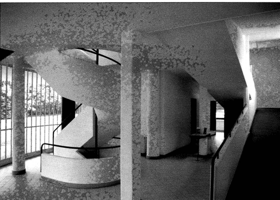
Villa Savoye. La hall d'entrée.