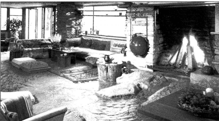
Fallingwater. Le salon et l'âtre.