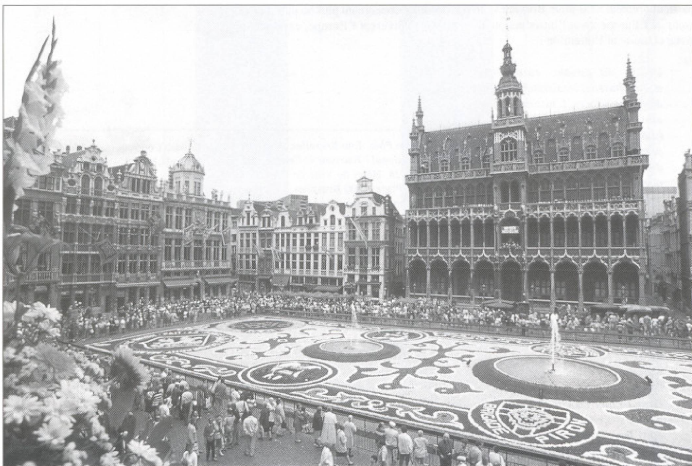
Tapis de fleurs sur la Grand-Place.

nonchalance du temps » ; l'art des saveurs, « plaisir des yeux et régal des papilles » ; la ville de toutes les musiques, y compris des langues, annonçant déjà pour 2003 Jacques Brel à Bruxelles ; enfin, la ville aux cent marchés dont rendent compte de nombreux noms de rues et de places. L'autre piste propose des promenades à la découverte du Centre historique de la ville-basse, via le Mont-des-Arts vers le quartier royal, culture des musées et verdure des parcs, jusqu'au Cinquantenaire et au quartier européen, télescopant la grandeur du passé avec la dynamique du futur d'une Europe en devenir 6 . Pour y parvenir, le Guide et Plan, Tout Bruxelles fournit les coordonnées et les renseignements utiles au regard de ces divers ingrédients. À remarquer qu'un des chapitres (p. 24-25), intitulé « Le Cœur de Bruxelles bat pour l'Europe », rappelle l'implantation dans la capitale de l'Union européenne ainsi que