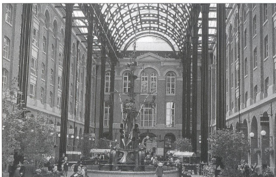
L'héritage du commerce au long cours au service de la régénération urbaine.

Lorsqu'elle accède au trône en 1837, la reine Victoria aurait difficilement pu soupçonner l'envergure des bouleversements qui affecteraient Londres durant son règne de 64 ans. L'explosion urbaine, favorisée par le transport ferroviaire, poussera les terrasses dans toutes les directions. La population passera, en un peu plus d'un siècle (1801-1911), de 1,1 million d'habitants à plus de 7,2 millions. Le développement du commerce au loin nécessitera la construction de vastes docks destinés à décongestionner la Tamise et à faciliter