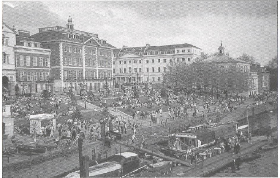
Terrasse riveraine à Richmond, au cœur de la Tamise arcadienne.

Dans la première moitié du XVI e siècle, Henri VIII continue sur la même lancée avec panache. Si le souverain est surtout connu pour le triste sort qu'il a réservé à certaines de ses nombreuses épouses, pour la rupture avec Rome qu'il a imposée à l'Église d'Angleterre et pour la dissolution des monastères, son action sur le terrain laisse un héritage remarquable (Adamson, 1999 : 95-117 ; Howarth, 1997 : 11-49). En effet, il construit ou reconstruit plusieurs palais à Londres (Whitehall) et dans ses environs (Eltham Palace, Greenwich Palace, Hampton Court Palace, Nonsuch Palace, Windsor Palace). Il prend possession de domaines ecclésiastiques et préside à leur redistribution, s'assurant ainsi la loyauté de ceux qui bénéficient de son patronage. Il réserve également de vastes superficies à l'ouest de la City pour en faire des parcs royaux de chasse. Les palais et leurs imposants domaines, de même que les réserves du West End , marquent de manière durable l'évolution de l'espace londonien. Ces réserves, ultérieurement ouvertes à la population, structurent plusieurs des secteurs résidentiels parmi les plus prestigieux de la Capitale. Certaines, à l'instar de Hyde Park, de Green Park et de St. James Park,