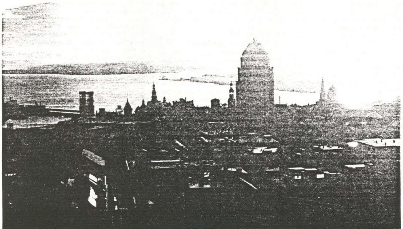
Le Saint-Laurent: une ressource à mettre en valeur.