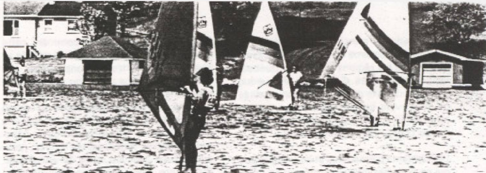
Les facteurs qui concourent au processus de contre-urbanisation dans les municipalités de villégiature relèvent plus de ce qu'on appelle la qualité de vie.

La contre-urbanisation, un phénomène temporaire? Les problèmes économiques, le coût de l'essence par exemple, peuvent-ils freiner cette tendance? A première vue, c'est un changement migratoire qui semble avoir des bases solides et qui pourrait bien se poursuivre; c'est un phénomène dont les aspects restent à approfondir.