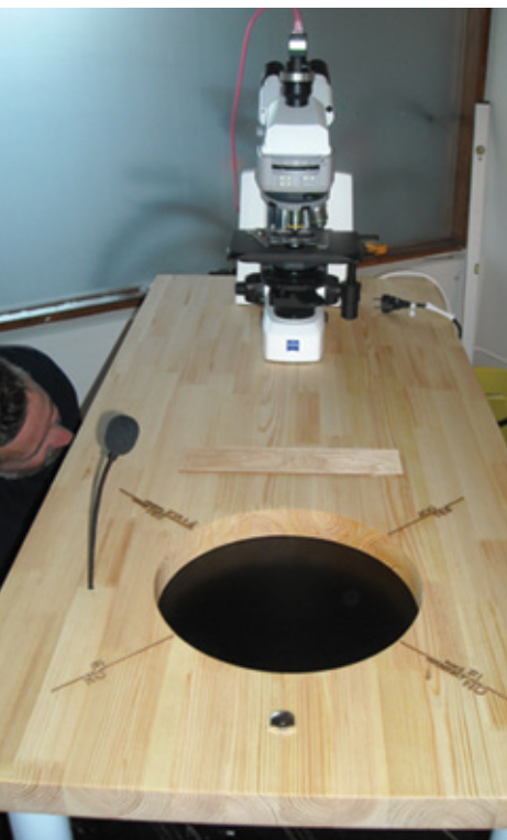
Your Synthetic Future (at the speed of light) Installation (vue de dessus)

visualiser un ensemble de créatures synthétiques présentées comme des chaînes de symboles adaptés du lexique iconographique d'un logiciel libre d'édition d'ADN (du type CrispR, mais non propriétaire). Erich Berger a programmé les créatures en question à l'aide des logiciels adéquats afin qu'elles évoluent dans le milieu numérique rendu présent par la médiation d'un ordinateur personnel minimal, lui aussi installé sous la table. Enfin, la table est équipée d'un microphone avec interrupteur, et le trou de l'écran est orné, sur ses bords, d'inscriptions en anglais et en finnois qui se traduisent par «oui», «non», «peut-être que oui» et «probablement pas». Un manuel qui indique les instructions rudimentaires pour interagir avec l'œuvre est aussi disposé sur la table, au-dessus du trou.