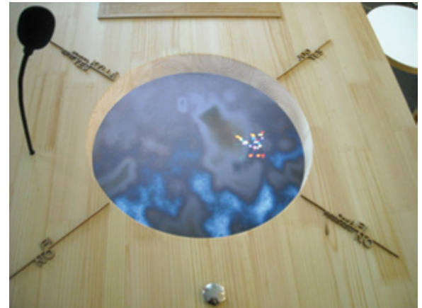
Your Synthetic Future (at the speed of light) Détail de l'installation

L'écran évoque le puits de divination des pratiques chamaniques scandinaves (en particulier norvégiennes) connues sous le nom de seidh ou seidhr . Les quatre inscriptions autour de l'écran rappellent une version élémentaire du ouidja utilisé dans les séances de spiritisme. L'installation est aussi conçue pour évoquer, sous une forme technoscientifique contemporaine, les machines prophétiques que l'on retrouvait, il n'y a encore pas si longtemps, dans les fêtes foraines où, contre très peu d'argent sonnante et trébuchante, le visiteur pouvait trouver instantanément réponse à ses questions concernant son futur.