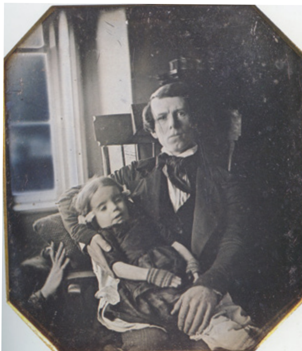
Daguerréotype, 1842 Un père et sa fille, anonymes, 9,75 cm x 10,80 cm