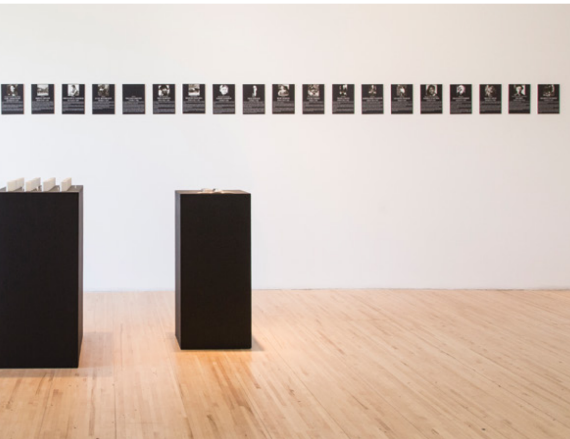
Projet EVA (Simon Laroche et Étienne Grenier) Micro-monuments souvenirs (Bientôt en vente !) , 2015. Archives de production.

Au directivisme du gouvernement, à la réduction idéologique et au cloisonnement du terme communisme de même qu'à l'unicité du monument, l'exposition Monuments aux victimes de la liberté répond par la multiplication des voix et la profusion d'objets dont certains tendent à déconstruire la forme traditionnelle du monument jusqu'à sa disparition.