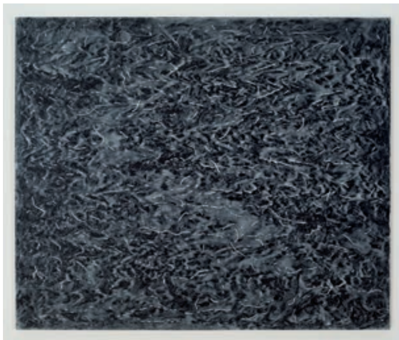
Détail d'un tableau en cours, acrylique sur toile, 102 x 122 cm, 2013

Avant de se plonger tête première dans la peinture, Verret avait déjà beaucoup exploré le travail photographique, à l'époque de l'analogique. C'est par ce