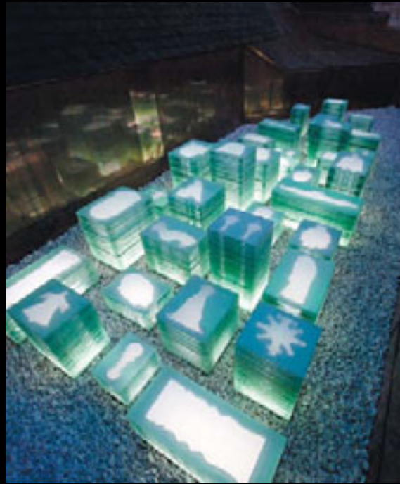
Mirabilia (nuit)

de 1966 ; une tête de déesse, provenant d'un bas-relief du Palais d'Angkor Vat au Cambodge, arrachée et pillée par André Malraux en 1923 ; la Croix de Pierre Ayot , l'une des dix-huit œuvres démantelées par l'administration Drapeau lors de l'événement Corrid'Art en 1976, etc. L'objet disparu se manifeste à nous en creux dans le monolithe de verre, son pourtour et son centre nimbés de lumière suggérant sa forme et son volume. Un objet auratique, fantomal en somme. La conjugaison des pleins, des vides et de la lumière rend vivantes les œuvres recherchées. L'éclairage électrique nocturne, émanant des cubes, anime cette ville dans la ville comme une illumination qui ravive notre mémoire.