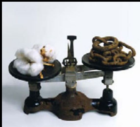
Balance, 1991 Assemblage (balance, chaîne et fleurs de coton), 22 x 35,5 x 17 cm

Le projet Mirabilia suggère à la fois le mandat principal de toute institution muséale, soit la collection et la conservation des œuvres et des monuments du patrimoine artistique, et