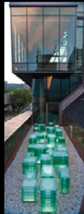
Mirabilia (arcarts de Montréal, Architectes : Provencher Roy Associés