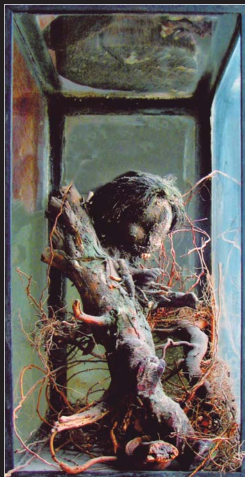
Christine Palmiéri, Restes mutants , 1995 Installation-sculpture, 60 cm x 40 cm x 40 cm, bois, terre, silicone, poupée de caoutchouc, aquarium

Pour se débarrasser de la sublime illusion que l'avenir est inépuisable, nous voulons envisager que le temps s'arrête. Car le temps sépare la pensée et le mouvement. Quand la pensée redevient mouvement, quand le désir est