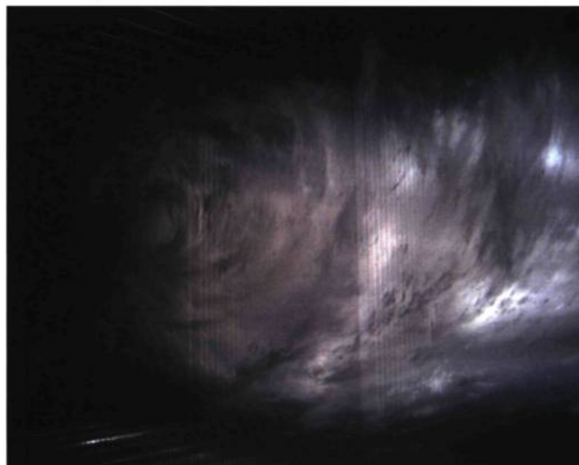
David Spriggs, Axis of Power , 2009

Les beaux dimanches était effectivement pour ma famille et moi un