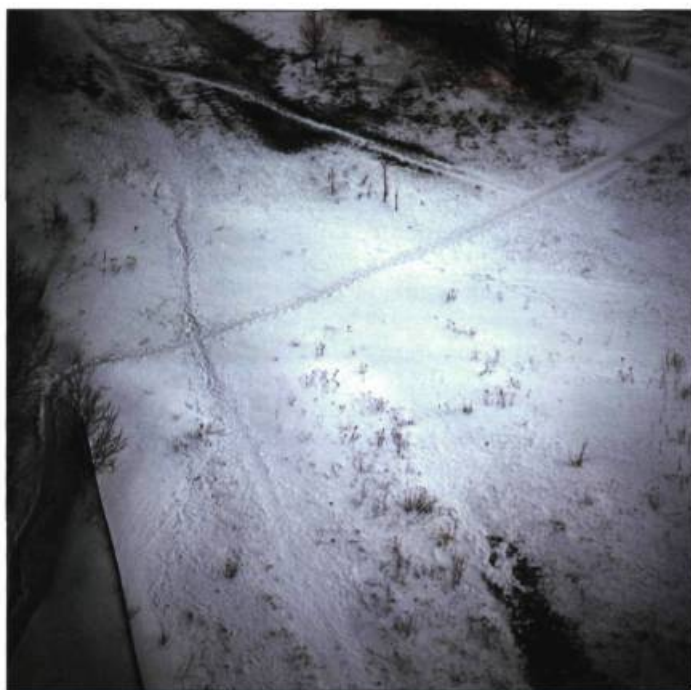
N° 205 Emmanuelle Léonard

Rencontre , 2003, acrylique sur toile, 145 cm x 217,5 cm.