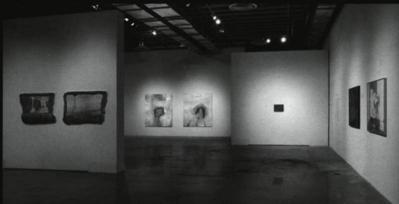
Nicolas Baier, vue d'installations. Paréidolies, MOCCA, Toronto, Hiver 2009.

Une autre boucle est ainsi bouclée. Encore une fois, Nicolas Baier donne à voir et apprend à regarder. Il tend ses fabuleux miroirs, propose ses brillants reflets, soumet ses pénétrantes réflexions. On est alors tenté de pousser l'allégorie centrale de cette production en référant aux neurones miroirs, ces unités fonctionnelles du système nerveux qui sont supposées jouer un rôle dans l'apprentissage par imitation. Ces neurones s'activent quand un individu en voit un autre réaliser la même action que celle pour laquelle elles se mettent en branle quand lui-même la pratique, d'où l'effet miroir. Selon certaines hypothèses des neurosciences, ces cellules pourraient jouer un rôle dans l'empathie, le dégoût, la cognition sociale, y compris le langage, l'intercompréhension et bien sûr dans l'art, ce miroir embué tendu à notre société... ☞