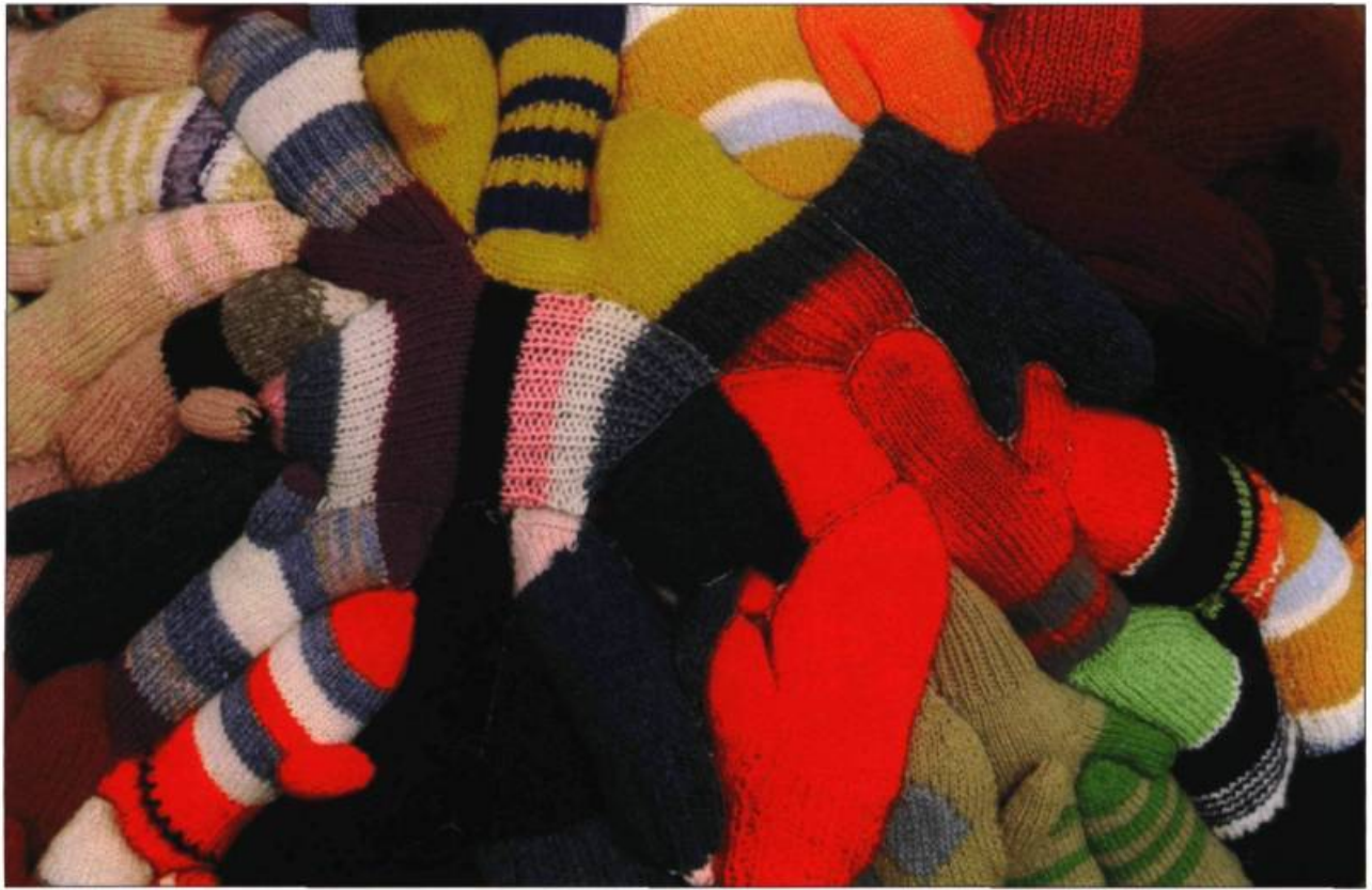
Nathalie Bujold, Variation bûcheron En Wing en Hein, Stride Gallery, Calgary, 1998. peinture acrylique (9.49 m).