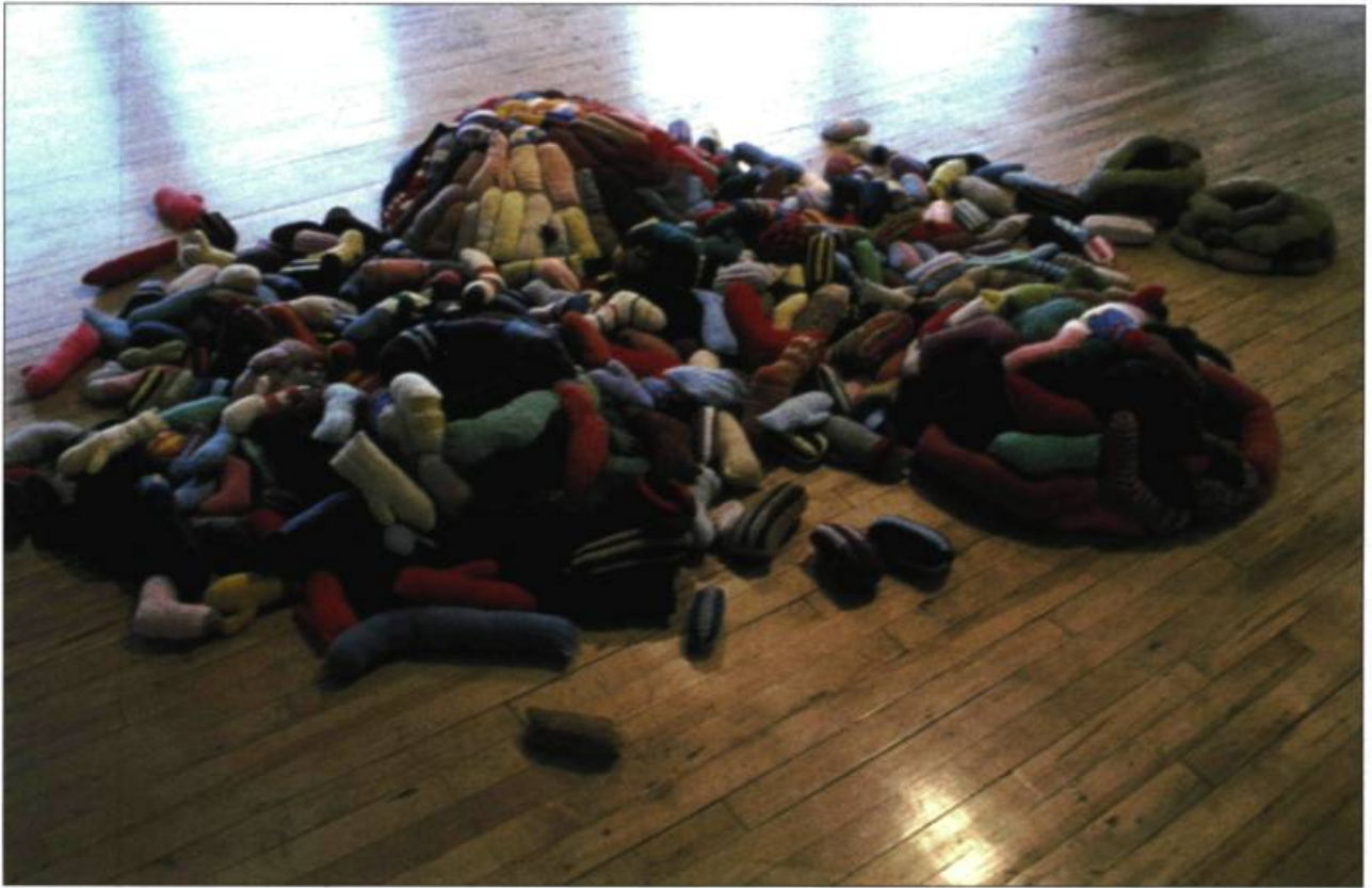
Nathalie Bujold, Variation bûcheron En Wing en Hein, Stride Gallery, Calgary, 1998. peinture acrylique (9,49 m).