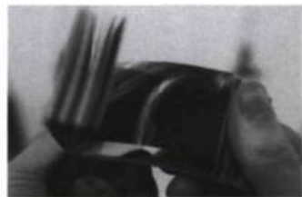
Nathalie Bujold, Pixels et petits points Centre d'art et de diffusion Clark, Montréal, 2004. Livrets d'images animés, impression au jet d'encre sur carton. (2,5 m X1 X 5 m).

mes temporelles archaïques persiste ou, plus précisément, revient pour hanter les pages de certaines fables historiques (mais peut-être est-ce là justement ce qui est moderne ici, c'est-à-dire cette façon qu'ont les