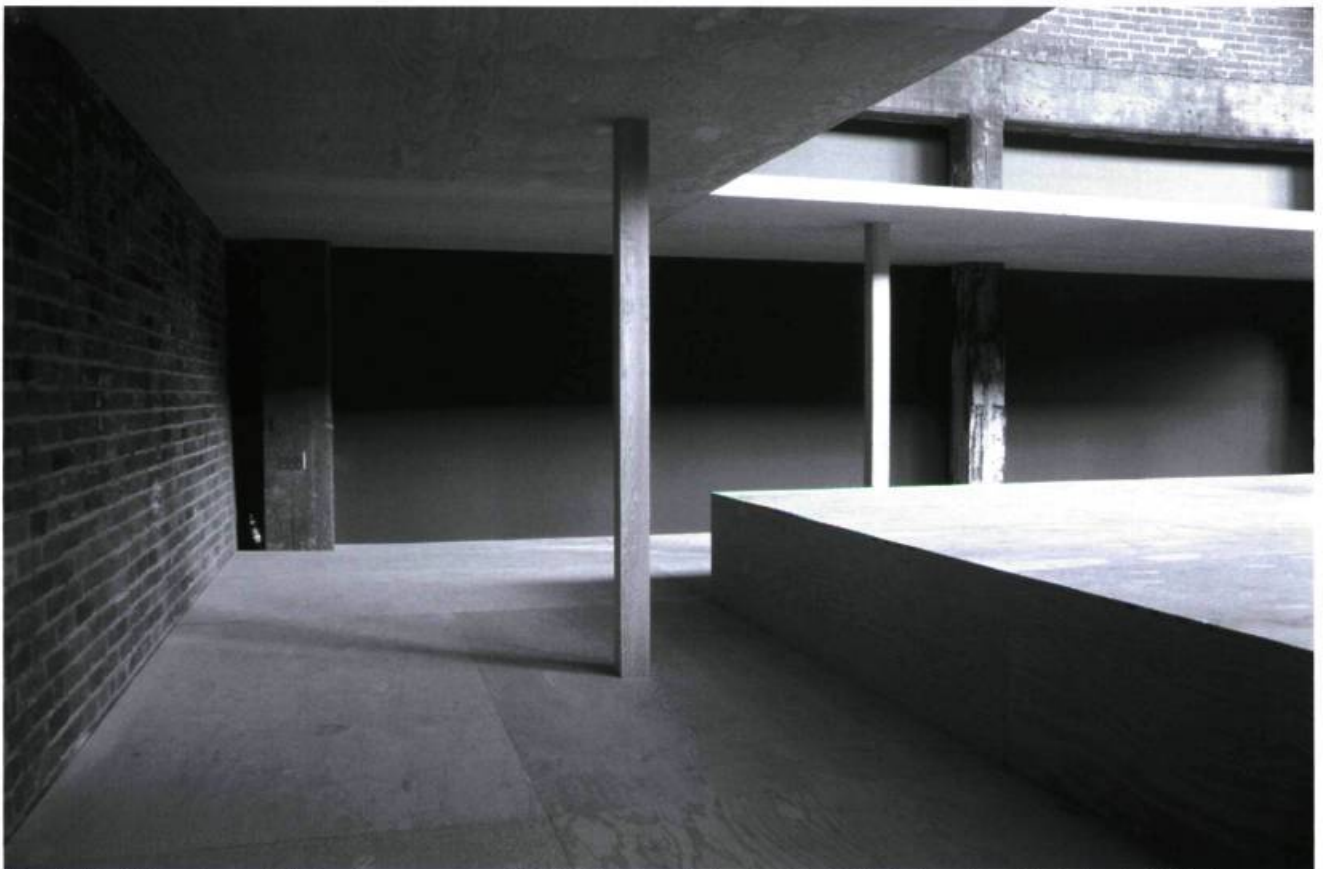
Alexandre David, Deux choses différentes (1 re œuvre, vue partielle), 2004, bois-contreplaqué. 267 × 1158 × 975 cm. Exposition à Quartier Éphémère à Montréal en 2004