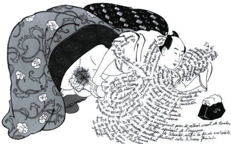
René Donais, Les calligraphies friponnes de l'amour , 1994, calligrammes de l'artiste sur des estampes japonaises érotiques, 38 × 21,5 cm.