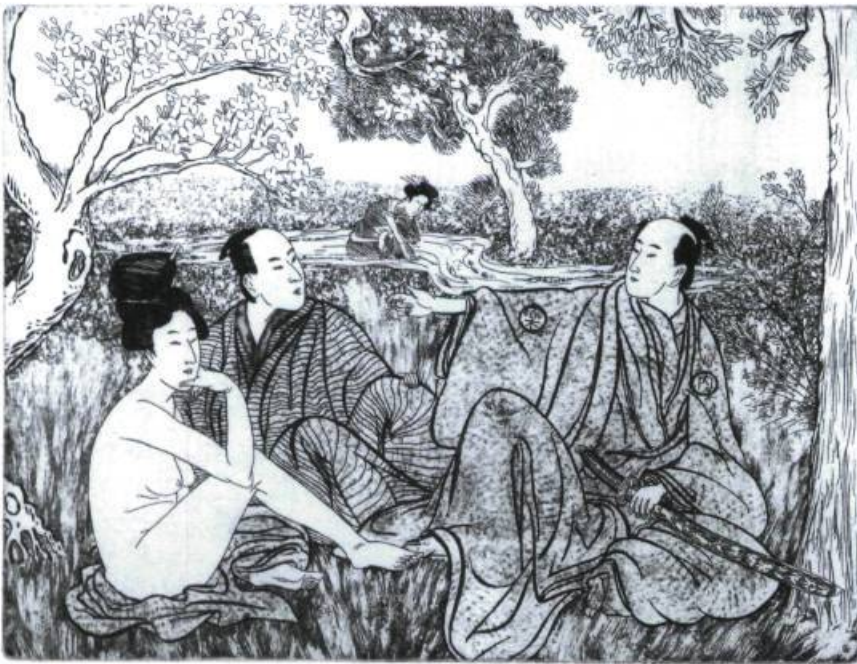
René Donais, Sans titre , création de la planche : 1988, impression : 2005, eau-forte, 17,5 × 22,5 cm.

artistes comme Manet... Mais Donais ne se laisse pas piéger dans un discours aussi facile. Il revisite autant des artistes impressionnistes que des artistes de la Renaissance ou du Baroque. Il me fait bien sûr penser à l'artiste japonais Yasumasa Morimura qui refait, en photographie, de célèbres tableaux ou gravures occidentales, mais en remplaçant tous les personnages par lui-même, en travesti. Un peu avant Morimura (je ne vous ferai pas le coup du jeu d'influence qui m'ennuie totalement), Donais nous dit