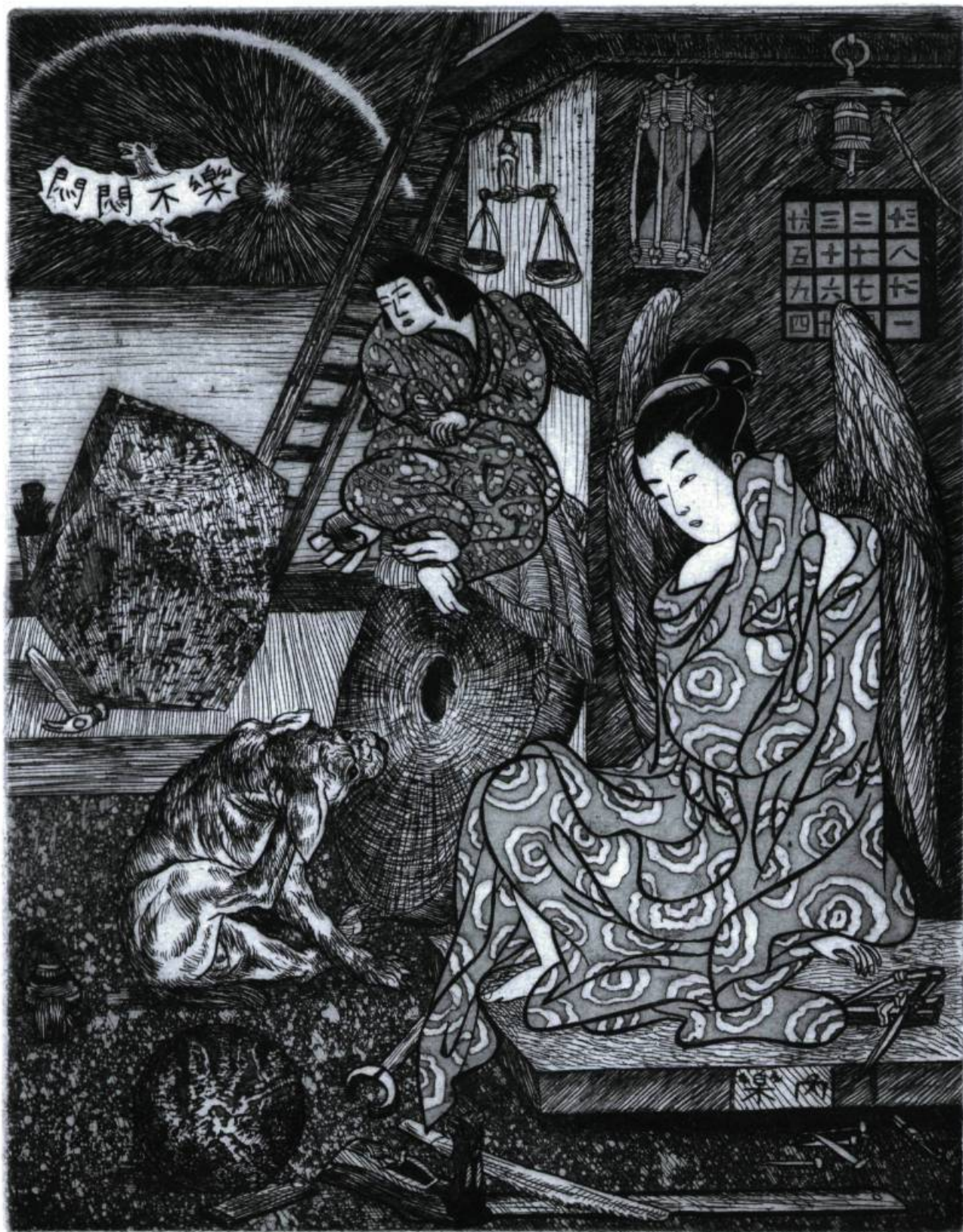
René Donais, Sans titre , création de la planche : 1988, impression : 2005, eau-forte, 22,5 × 17,5 cm.