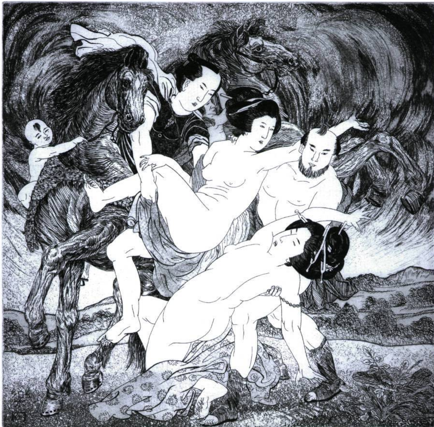
René Donais, Sans titre , création de la planche : 1988, impression : 2005, eau-forte, 30 × 30 cm.