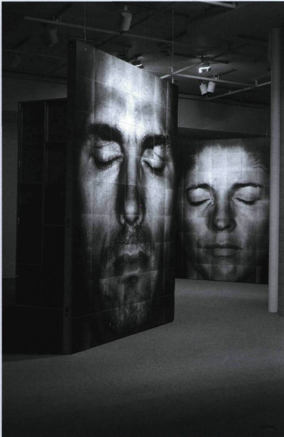
Roberto Pellegriuzzi, Les écorchés , 1999, 325 x 251 cm.

« La reine des géants, qui décidément appréciait beaucoup sa compagnie, lui fit construire, par les meilleurs artisans du royaume, une jolie petite boîte, confortablement meublée d'un hamac fixé au plafond, de deux chaises et d'une table vissées au plancher [...] Le capitaine la nommait fort joliment "my Travelling Closet", sa chambre de voyage. [...] Par les soins de Roberto Pellegriuzzi, la Galerie de l'UQAM s'est transformée, le temps d'une exposition, en une telle chambre de voyage. Ses œuvres récentes — trois paires de portraits photographiques monumentaux (325 x 251 cm) intitulées Les écorchés — semblent des fenêtres grillagées, à travers lesquelles nous pouvons apercevoir, comme Gulliver lui-même depuis sa petite boîte, des visages de géants endormis » (Olivier Asselin, « Le regard aveugle », critique de l'exposition Terra incognita. Les écorchés , Galerie de l'UQAM, du 1 er septembre au 9 octobre 1999).