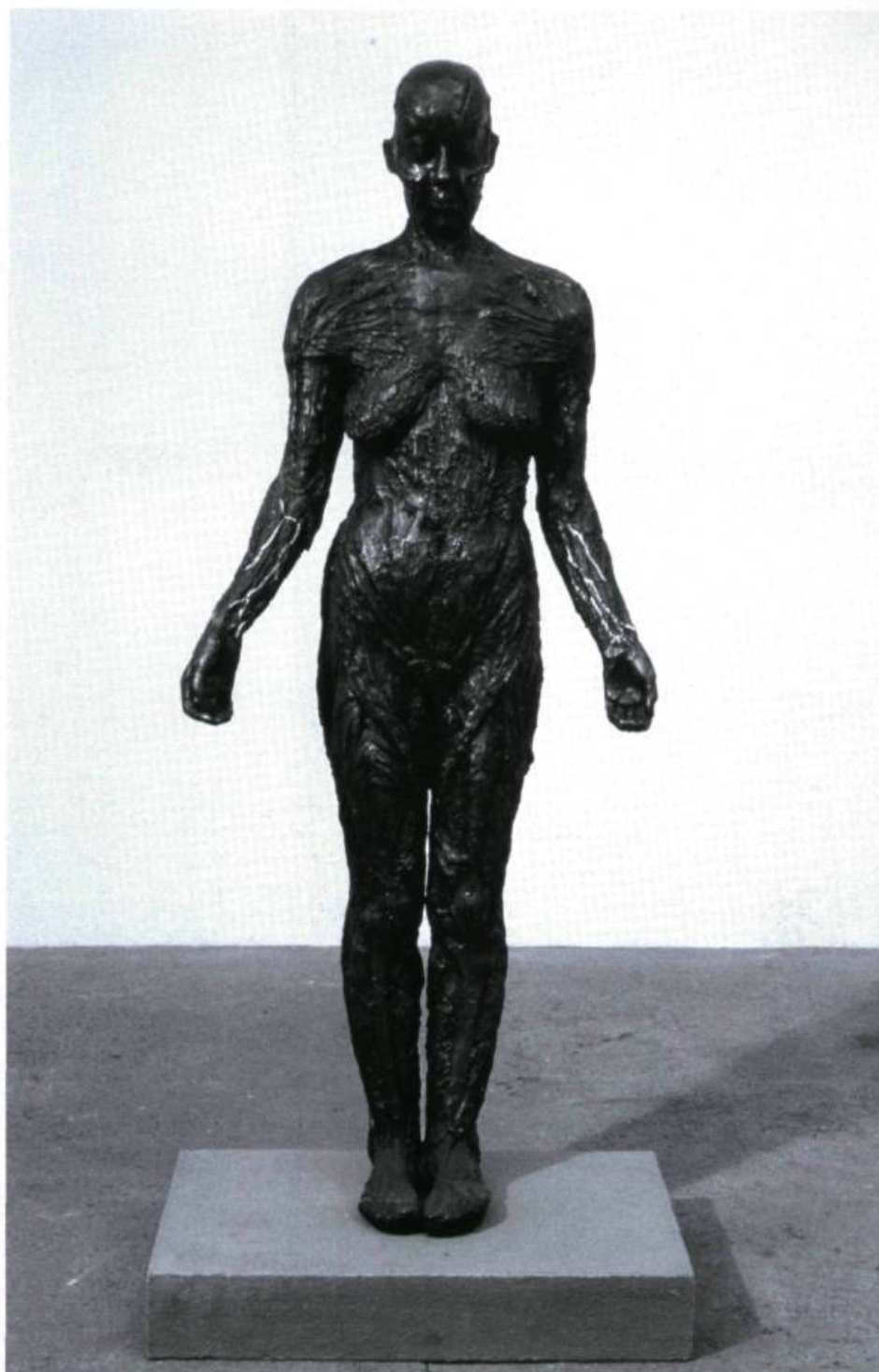
Kiki Smith, Virgin Mary , 1993, 167,6 × 68,5 × 48,2 cm. Bronze et argent