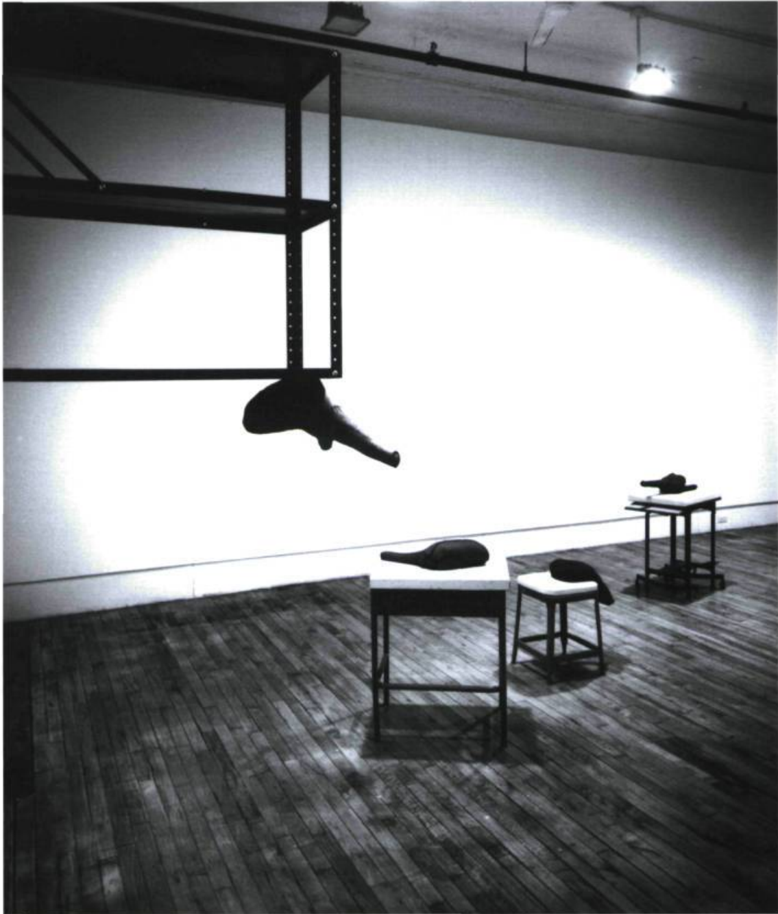
Stephen Schofield, A raging stream is called violent, but not the riverbed that hems it in , vue d'ensemble, Berland Hall Gallery, New York, N.Y.

supposée neutre à l'égard des canulars religieux de toutes origines. Même l'histoire politique récente rappelle les visites des premiers ministres québécois au Saint-Siège. Lucien Bouchard, le grand messie nationaliste, et son ancien acolyte conservateur maintenant chef de l'État québécois n'ont pas manqué, avec leur femme, de réclamer pour eux-mêmes des colifichets et autres médailles miraculeuses lors d'une visite à Rome.