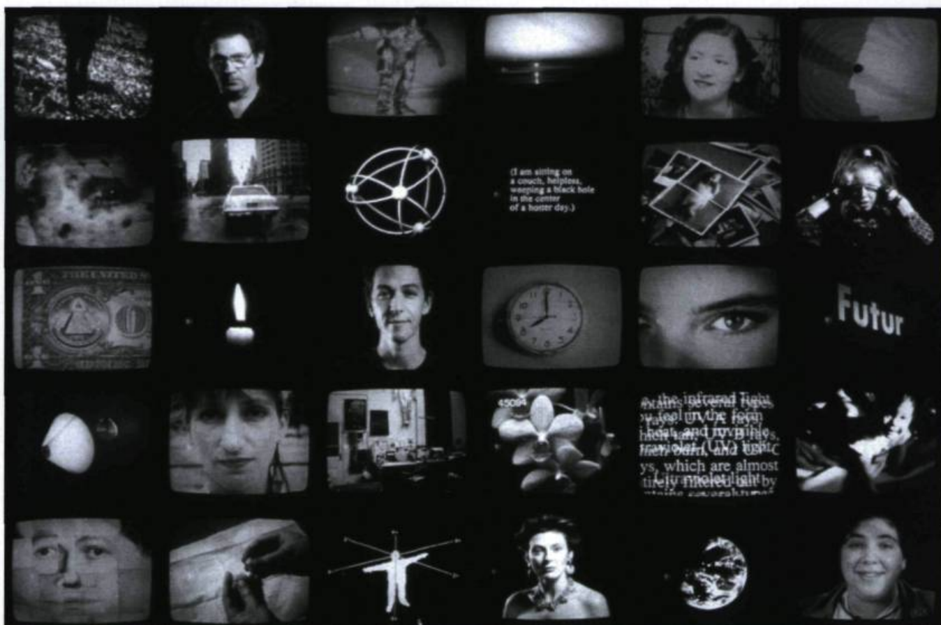
Luc Courchesne, mosaïque présentant divers moments de l'installation interactive L'Encyclopédie claire-obscur , 1987

« L'Encyclopédie claire-obscur est une installation vidéo véritablement encyclopédique avec ses 331 séquences vidéo de longueur variable, pressées dans un vidéo-disque (CAV monoface) avec une capacité de 54 000 images. Il s'agit du résultat de trois années de prises de vue et montage, et d'un travail continu de programmation visant à contrôler l'ordre de présentation des séquences : c'est-à-dire les ponts qui permettent de passer d'une séquence à l'autre dans un ordre quasi aléatoire, les boucles dans lesquelles on repasse indéfiniment par une même série de séquences en l'absence d'interruption extérieure, etc. L'Encyclopédie claire-obscur est comme un esprit entièrement peuplé d'images, laissé à lui-même dans le libre jeu des associations » (Michaël La Chance, « L'image est un artefact », critique de l'exposition L'Encyclopédie claire-obscur , P.R.I.M. Vidéo, du 16 février au 5 mars 1989).