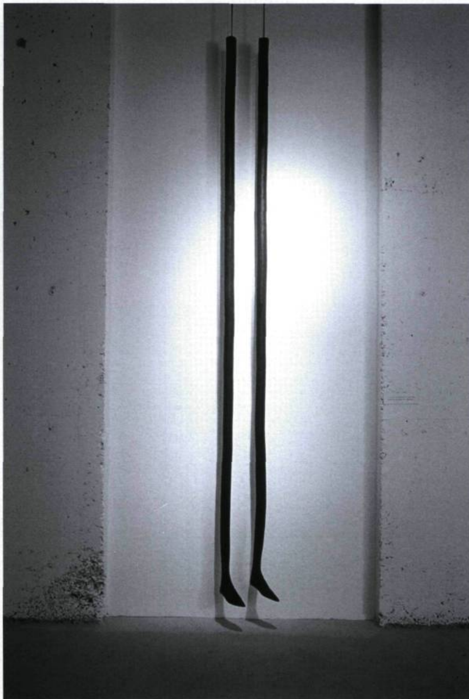
Louise Bourgeois, Legs , 1986, caoutchouc, 1 : 309 × 2 cm, 2 : 313 × 2 cm. Courtoisie CIAC (Centre international d'art contemporain de Montréal). Photo : Louis Lussier

« À partir d'une connaissance exceptionnelle de l'art contemporain, nourrie de poésie, avec un doigté subtil, il [le commissaire Roger Bellemare] a composé une section tout à fait impressionnante. Abordant le thème en se référant déclarativement au chemin de la Croix, il a sélectionné quatorze œuvres qui s'échelonnent de 1958 [...] jusqu'à aujourd'hui. Mais les œuvres ne sont pas des illustrations des étapes du chemin de la Croix. Chaque station a d'abord été interprétée comme un thème plus abstrait (ceux qui touchent toute l'humanité : angoisse, douleur, etc.) et les œuvres ont été choisies pour évoquer, par toutes sortes d'associations, le thème de chaque station. Le parcours de cette section est ponctué de surprises : la date du Rainer, les personnages de Lemire, entre autres. Souvent les artistes ne sont pas d'emblée identifiables ; par exemple, le Nauman, le Bourgeois dont l'accrochage est d'une ingéniosité à souligner » (René Payant, « Une rhétorique du ralentissement », critique de Stations , Centre d'art contemporain de Montréal, Place du Parc, du 1 er août au 1 er septembre 1987).