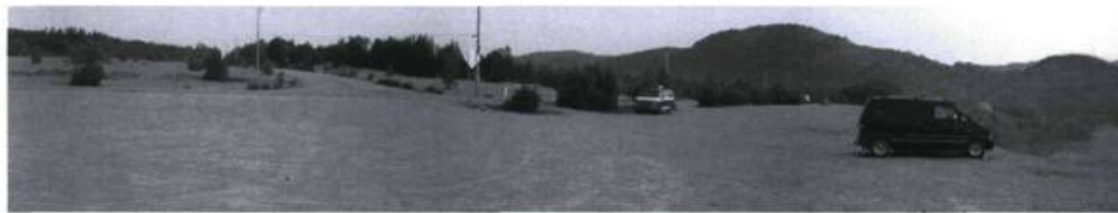
Ivan Binet, Étendues attendues , 2003, impression au jet d'encre, 350 cm × 20 cm, tiré de la série Répertoire d'horizons .

courage de dire comment ils ont formé leur œuvre, je crois qu'il n'y en a pas beaucoup plus qui se soient risqués à le savoir. Une telle recherche commence par l'abandon pénible des notions de gloire et des épithètes laudatives ; elle ne supporte aucune idée de supériorité, aucune manie de grandeur. Elle conduit à découvrir la relativité sous l'apparente perfection. »