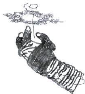
David Tomas, Planing the Future V: The incubator , 1999, mine de plomb et crayon de couleur sur papier/épreuve photonumérique

l'ouvrage de Fischer, que « le lyrisme peut à coup sûr se décliner sans naïveté, et la fascination se décliner avec l'esprit critique »? N'est pas Zarathoustra qui veut, diront les mauvaises langues... En effet, Fischer, pour respecter les objectifs qu'il se fixe, devrait à la fois exprimer sa fascination pour le numérique, ce qu'il fait très bien..., mais également pointer les dangers et les nouveaux risques qui accompagnent cette mutation culturelle. Or, il n'en est rien. La sphère de la techno-science sort intacte de la mythanalyse de Fischer. Si ce dernier s'en prend aux « fervents de l'utopie technologique », à aucun moment il n'examine les