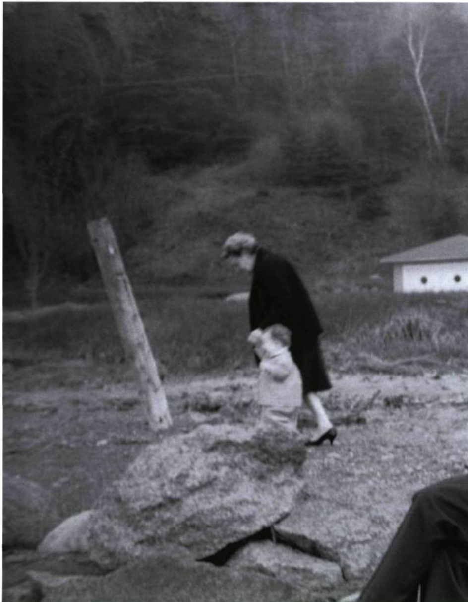
Raymonde April, Le monde des images , 1999, impr. au jet d'encre sur papier; 1 de 72 images, 10,8 cm X 40,6 cm. Photo prise vers 1950 par la mère de l'artiste

Mais le résultat anéantit ces appréhensions. D'une part, le spectateur de La cathédrale aveugle peut se référer au papier si un poème le touche et se retrouver en tête-à-tête avec lui : les textes sont reproduits dans le livre. D'autre part, la musique et les mots forment un tout. Ollivier Dyens explore les paradigmes d'un nouveau langage poétique. Il tente de découvrir comment les émotions produites par ce langage peuvent être exprimées. Ce faisant, il donne à ses poèmes une rondeur, une profondeur. C'est une poésie tridimensionnelle qu'il nous sert sur un anneau argenté dont on ne peut soupçonner l'étendue si nous y plongeons sans conviction. La voix qui lit les mots leur donne une épaisseur qui crée une brèche dans l'habitude de la poésie. La cathédrale aveugle change le rapport à l'espace : celui-ci devient double ou triple, et les niveaux de réalité s'imbriquent pour former un labyrinthe complexe de réseaux.