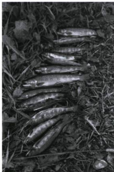
Raymonde April, Le monde des images , 1999, impr. au jet d'encre sur papier; 1 de 72 images, 76,2 cm X 50,8 cm

« Dans ce monde où tout est montré, il y a de moins en moins à voir, tout y relevant d'un regard comptable et non d'un regard regardant... » La syntaxe ne vient plus de l'articulation du continu sensé mais de la dislocation de soi devant toutes choses, l'irréférence, la vie de chacun secondarisée par l'image dans ce qui n'intéresse véritablement plus personne. Il n'y a pas de sujet de l'image : seulement une dispute d'ombres pour boire à toute la lumière disponible.