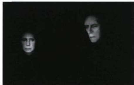
Les aveugles , de Maurice Maeterlinck. Fantasmagorie technologique conçue et réalisée par Denis Marleau, Musée d'art contemporain de Montréal, 2002.

Maeterlinck en supprimant effectivement de la scène les comédiens pour ne retenir que leurs voix et la projection de leurs visages animés sur des têtes de mannequins. Est-il besoin d'insister sur le fait qu'il n'est pas ici simplement question d'une utilisation conventionnelle ou accessoire de la vidéo, mais d'un recours exigé par le projet lui-même à une technologie complexe nécessitant « la contribution des outils et du personnel qui ont permis aujourd'hui le fonctionnement d'une pa-