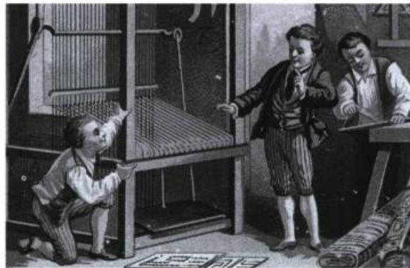
Avec son métier à tisser piloté par cartes perforées, Jacquard crée la première machine à programme externe (ou logiciel). Cf. Le Monde numérique , 2002, Larousse/VUEF

ou bien on loge du côté de Heidegger — qui considère que l'on passe à côté de l'essence de la technique si l'on accepte a priori sa neutralité —, ou bien on appartient au clan adverse : toute technique est bonne en soi et porteuse de promesses émancipatrices, tout dépend de l'usage que l'on en fait — comme si l'on pouvait faire autre chose que la guerre avec des chars d'assaut. Aussi caricatural que puisse paraître ce clivage — qui reproduit sensiblement la vieille dialectique de la diabolisation et de la divinisation des techniques, laquelle occupe une place de choix dans les imaginaires occidentaux —, il n'en demeure pas moins qu'il correspond au climat de polarisation extrême qui domine la sphère des techno-sciences dans la société québécoise.