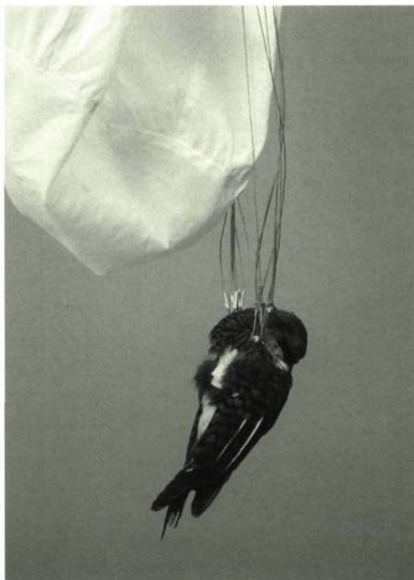
Rêve d'apesanteur de Josée Dubeau, 2001

Sous cet éclairage, les frontières de l'histoire se font poreuses, donnant à la démocratie le milieu fluide nécessaire à son parcours. Mais peut-être ne s'agit-il que de masquer « l'apparente dispersion de ces essais » par l'unité du thème démocratique? Prévenant lui-même cette objection, Pierre Vidal-Naquet justifie l'« ossature » du recueil par trois mots : « variété, croisement, détour », derrière lesquels se dessine la trajectoire suivie par les études grecques en France depuis le milieu du siècle. S'inspirant du topos de l'abeille et du miel, l'historien butine d'un siècle à l'autre, tirant de la « variété » « la substantifique moelle » (Rabelais). Le « croisement », lui, appose et oppose pour engendrer une nouvelle lecture. Tout le chapitre I, « Hérodote et l'Atlantide : entre les Grecs et les Juifs », découle de ce métissage. Quant au « détour », en l'occurrence par le XVIII e siècle, il est justifié par le fait que l'âge classique s'est édifié tout entier sur les vestiges de l'Antiquité : l'imitation des Anciens, la mimesis d'œuvres matricielles,