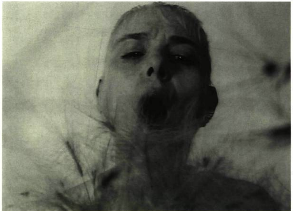
Du front tout le tour de la tête , extrait, de Chantal duPont, 2000

un froissement de dentelles ou de robes de taffetas, cette préciosité intelligente qui rebute bon nombre de critiques et qui est malencontreusement encore prise pour de l'esbroufe littéraire quand il s'agit bien plus souvent des symptômes inhérents à un style aventureux, vif et riche de