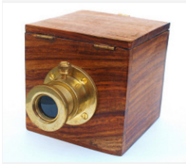
FIGURE 2 – La camera obscura de Niépce

mation des images (entendez ajustement à l'aide de fonctions apparentées à Photoshop) ont été intégrées à la caméra. Ces avancées techno-logiques ont assurément facilité la production du visible . Force est toutefois de songer, pour simplifier sans doute à l'extrême, à la capacité qu'avaient les photographes qui, entre la camera obscura et la caméra numérique, ont continué à placer leurs appareils au bon endroit, de s'ajuster à l'environnement. À partir des négatifs, certains ont pu décider de ne pas développer les images jugées moins réussies ou importantes. Autrement dit, les choix ont, à un moment, non seulement porté sur les modèles (sujets ou objets) visés à l'aide de l'appareil, mais sur le développement des prises de vue, voire, pour revenir à l'idée heideggerienne, sur le dévoilement d'étants de choses, soit celui des choses de l'être. En bref, depuis l'intersecteur (d'Alberti) ou l'héliographie (de Niépce) jusqu'à aujourd'hui, des ouvrages interviennent à plusieurs étapes de la production du visible. La photographie numérique permet le saisissement d'objets, de même, en effet, que leur transformation ou de nouveaux ajustements à l'aide de logiciels spécialisés. Tout intersecteur (voile, dispositif, appareil argentique ou numérique) satisfait ainsi un dessein ou est promis à une destinée.