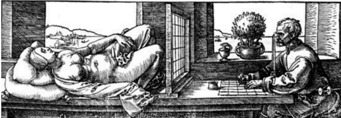
FIGURE 1 – L'intersecteur d'Alberti

Envisageant ce que le dessin dévoile (une femme nue allongée), et ce, à titre d'exemple d'ouverture de la tekhne , l'on remarque que, à une certaine époque, il était exécuté à l'aide d'un dispositif plus rudimentaire que ceux qui sont associés aux techniques actuelles. L'intersecteur, qui a été inventé par Alberti, et dont nous reprenons la description plus loin, a permis de reproduire des modèles sous la forme d'un dessin, d'un tracé. Des ajustements étaient déjà nécessaires, car il a fallu poser le dispositif quelque part, choisir un modèle et le faire au gré d'une intentionnalité fondatrice.