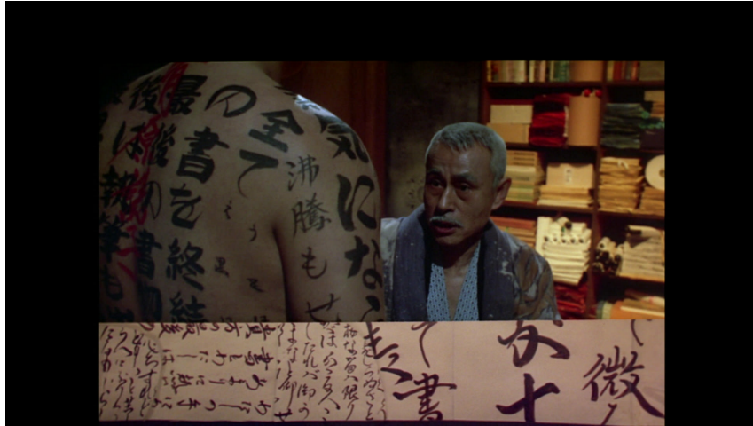
FIGURE 4 – The Pillow Book de Peter Greenaway

tion/recomposition de l'image. À la notion de plan , espace unitaire et homogène, la vidéo préfère celle d' image , espace démultipliable et hétérogène. Au regard unique, structurateur, le principe de l'agencement signifiant et simultané des vues. C'est ce que j'appellerai, dit-il, l'image comme composition (Dubois 1995, 168).