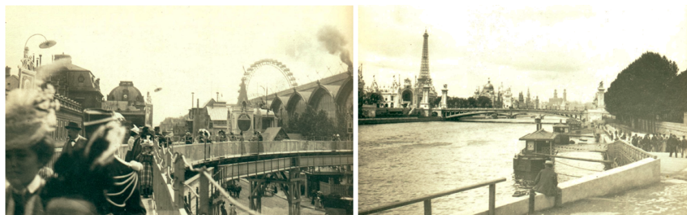
FIGURE 6 : Clichés de l'Exposition universelle de 1900 pris par Zola (Émile-Zola et Massin 1979) Qu'il soit au centre des images où derrière elles, l'écrivain est partout dans ces images d'un présent éternellement conservé dans l'ambre de la pellicule, d'autant plus que celle-ci est maintenant numérisée.