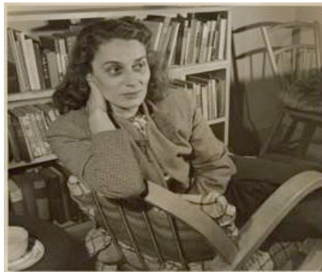
Gabrielle Roy en 1946.

L'exposition de Bibliothèque et Archives Canada a présenté un total de cent quarante pièces (manuscrits, objets, photos), orientées d'abord autour du parcours biographique de l'écrivaine, depuis son enfance à Saint-Boniface jusqu'à sa carrière de journaliste-pigiste pour des journaux et revues montréalais au tournant des années 1940, puis de la parution de son plus grand succès, Bonheur d'occasion , en mettant surtout l'accent, en dernier lieu, sur la part autobiographique de l'œuvre ( Rue Deschambault , La Route d'Altamont , Ces enfants de ma vie et La Détresse et l'Enchantement ). Exploitant non seulement l'écrit, mais aussi les matériaux visuels et sonores, l'exposition a également mis en valeur certaines éditions de luxe des œuvres royennes ainsi que des tableaux d'artistes – comme ceux du peintre Jean-Paul Lemieux – ayant illustré quelques-uns de ses romans.