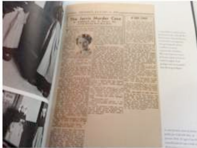
« The Jarvis Murder Case » : le tout premier texte publié par G. Roy.

une magnifique collection de photos et de documents iconographiques, dont de nombreux inédits, qui rappellent les principales étapes de la carrière de l'auteur de Bonheur d'occasion 11 . »