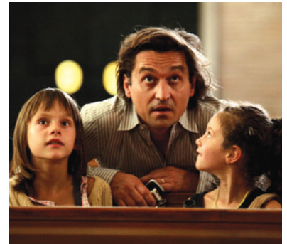
— Le père de mes enfants