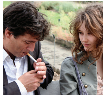
— Tout est pardonné