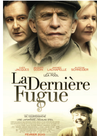
La dernière fugue Léa Pool